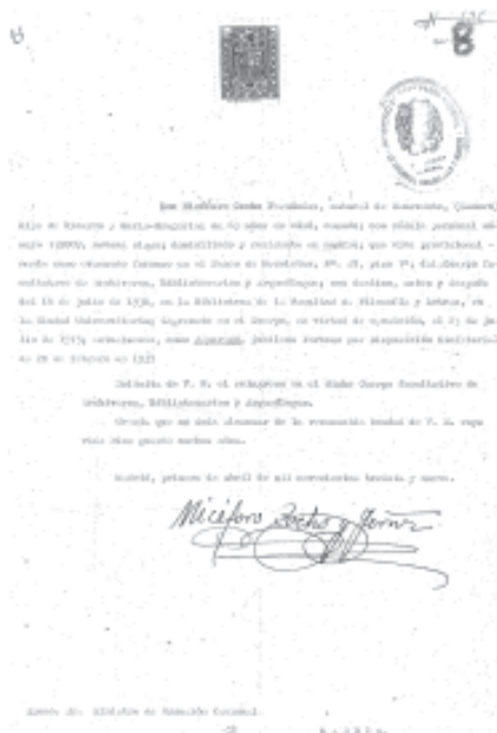
Doc. 2: Solicitud de N. Cocho ás autoridades franquistas para o seu reingreso no CFABA tras a finalización da guerra, seguindo o establecido pola Lei de 10 de febreiro de 1939. Data: 1 de abril de 1939. AGA, Edu., 31/6056.