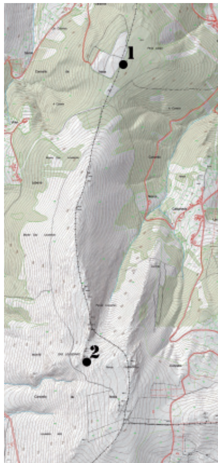
Fig. 1.- Plano de situación dos túmulos de Cortella e Louseira (Neda)..

Postos a aclarar despropósitos sobre este túmulo, dicir que non é un dolmen, nin está no lugar de Chao de Aldea (Viladonelle), como poñen a maioría de artigos e noticias publicadas en internet.