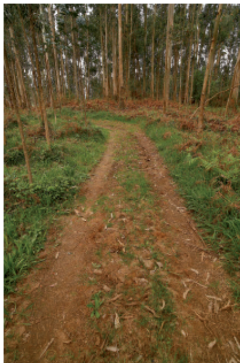
Foto 5.- Mámoa de Muiño do Vento(Mugardos).

En referencia á relación dos túmulos cos cursos de auga, vemos que a maioría están bastantes separados deles, que son os situados na dorsal do monte Marraxón. Entre 600 a 700 m hai 5 túmulos (15%); entre 400 a 500 m, 10 (30%); entre os 300 a 400 m, 11 (33%); entre 200 a 300 m, 5 (15%) e a tan só unha distancia inferior ós 200 m, dous túmulos (7%).