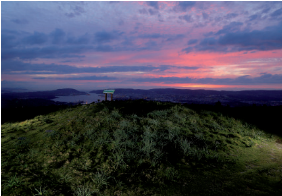
Foto 6.- Mámoa do Coto do Rei (Fene), situada nun lugar privilexiado sobre a ría de Ferrol.

Á vista destes datos, pódese dicir que a pesares da proximidade entre as zonas, hai unha diferenza salientable nas medidas dos túmulos sendo máis pequenos os localizados nas partes máis elevadas (entre as cotas 325 a 421 m; Monte Marraxón – Pena Louseiras) onde dos 24 túmulos localizados, tan só dous pasan de 18 m nalgún dos seus eixos, mentres que os máis grandes son os das zonas máis baixas (entre as cotas 66 a 85 m; concellos de Mugar dos e Ares), onde todos eles presentan unhas medidas entre os 19 a 28 m nalgún dos seus eixos.