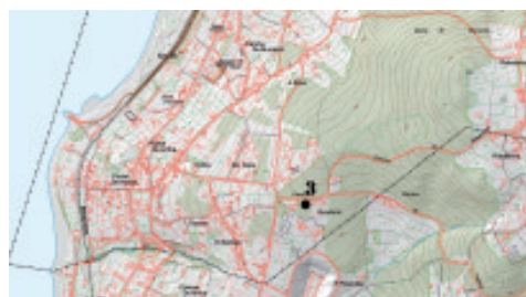
Fig. 2.- Plano de situación do túmulo de Gunturiz (Neda).

3) Mámoa de Gunturiz (coordenadas UTM 568242 – 4815310, xeográficas 08° 09'21,99" – 43° 29' 12,52"). Emp.: Ladeira. Alt.: 114 m. Reg.: 400 m. Subst.: Granito de dúas micas moi deformado. Terr.: Monte baixo. Med: 11 m de Ø x 0,40 de alto; burato de violación 3 m de Ø x 0,20 de profundidade. Est.: Regular, e en perigo xa que está situada nunha zona urbanizable. Na actualidade entre dúas casas. (fig.2)