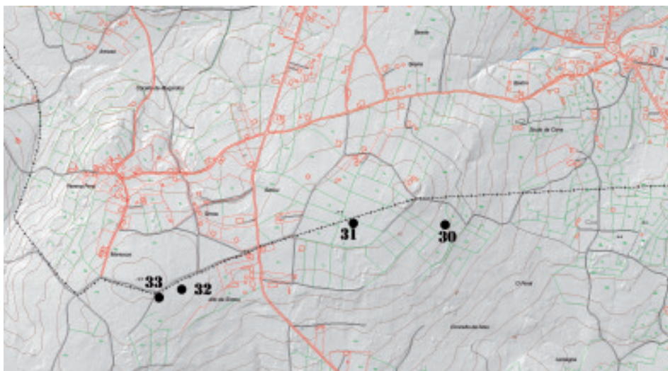
Fig 6.- Plano de situación dos túmulos do linde dos concellos de Mugardos e Ares.

En canto á altitude, os datos que nos aporta esta análise non son fiables, xa que a maioría (70% - 23 túmulos) se encontran nas cotas de 320 a 355 m, pero estes túmulos correspóndense integramente coa zona do Monte Marraxón. O resto dos túmulos en zonas altas son: tres deles (9%) nas cotas de 186 e 228 m; un na cota de 114 e un túmulo na cota dos 421 m, que se corresponden coa Pena Louseira, no linde dos concellos de Neda e San Sadurniño. Destacan polo inusual os localizados en zonas baixas (5 túmulos – 15%, nas cotas entre 66 a 85 m, que tamén corresponden a unha zona concreta: os concellos de Mugardos e Ares). Con total seguridade esta proporción sería maior si se tiveran conservados os túmulos de chaira, pero estas soen ser zonas moi traballadas pola man do home.