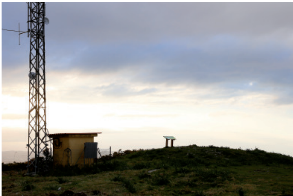
Foto 2.- Mámoa do Coto do Rei (Fene) na que se poden apreciar as diferentes agresións sufridas ó longo do tempo.