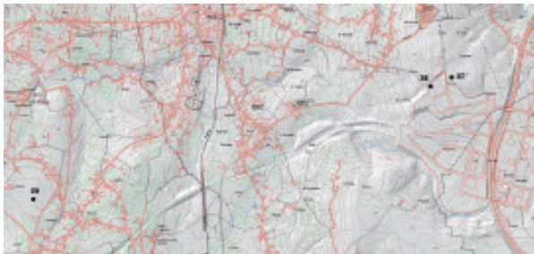
Fig 5.- Plano de situación dos túmulos de Vilar do Colo (Fene) e Monte do Pazo (Mugardos).