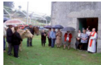
Ritual de bendición do gando no Cadramón (O Valadouro).

En varios santuarios da provincia lucense preferentemente os ofrecidos ao San Antón, San Cosme, San Bento e San Adriano, celebrábanse, na véspera da festividade do santo, unha serie de rituais que ían destinados á cura e protección dos animais. Nese día, abondos campesiños, que vivían no ámbito de influencia do santuario, acudían con cadansúas reses para cumprir coas seguintes cerimoniais: