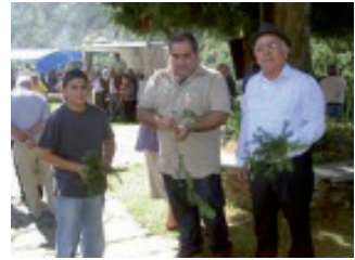
As ramas de teixo do santuario de Conforto (A Pontenova) protexen a facenda familiar.

Preto do santuario do San Estevo en San Cosme (Barreiros) hai unha fraga, que leva o nome do santo, na que algúns romeiros o día da festividade – o primeiro fin de semana do mes de xullo- cortaban varas das árbores, que alí se atopaban, e levábanas para as súas casas, usándoas preferentemente co gando vacún. Actualmente aínda hai mostras deste ritual, que presenta certo paralelismo co dos santuarios ofrecidos ao San Xurxo, onde os devotos pasan pola imaxe do santo unhas varas parecidas ás que utilizan para conducir o gando 26 .