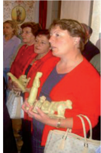
Devotas oíndo misa con exvotos de cera como ofrenda (A Rigueira, Xove).