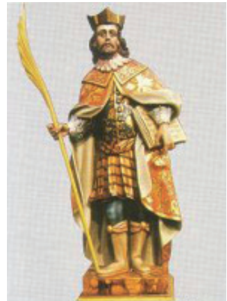
SAN COSME DA MONTAÑA GALGÃO - Abadín (Lugo)