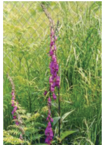
O Milicroque, símbolo protector da facenda.

Antano, tanto na celebración do Corpus como doutras festividadeas, poñíanse polos adros das igrexas da provincia espadanas e outros vexetais, que quedaban sacralizados ao paso das diferentes entidades sagradas. Isto motivaba que algúns fregueses, ao rematar a procesión, adoitaban levar para as súas casas algunhas espadanas. Estas colocábanse nalgún lugar das casas e dependencias anexas como cortes, estábuloas, cunha finalidade protectora ante todo aquilo, que puidese causar algún dano á facenda familiar. Este ritual seguíase utilizando ata hai ben pouco tempo nalgúns freguesías dos concellos de Begonte, Outeiro de Rei, Friol, Portomarín, con motivo da conmemoración do Corpus.