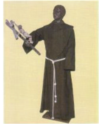
SAN BENTO DE PALERMO QUE SE VENERA EN LA IGLESIA DE CARBALLO (FRIOL) SU FIESTA SE CELEBRA EL 3 DE MAYO

Os escritos poden ser específicos, dirixidos contra o mal de ollo, as treboadas, o demo etc, ou contra calquera tipo de mal en xeral, empregándose mesmo para a protección e curación do gando 33 .