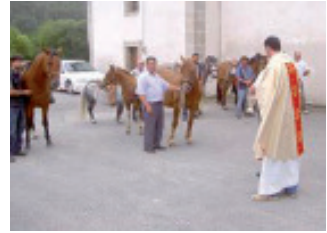
Ritual da bendición do gando na Rigueira (Xove).

Por outra banda, tanto nas casas da comunidade parroquial, como nas dos devotos do santo, cando se perde algún obxecto, ou se extravía ou enferma algún animal da facenda, adoitan recitar o ensalmo do santo tres veces, sen se equivocar. Este, empregado en moitas comunidades devotas do Santo, amosa a mesma reiteración tripla da estrofa de « El mar sosiega su ira... » 15