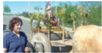
O San Cidre de Paradela.

A S. Antón da Xestosa / anxo, patrón, vixía./ Nesta parroquia nosa / alumas y eres guía./ Non te esquezas de nós./ Tampouco das colleitas ./ Os gandos serán bós./ Non haberá desfeitas/.