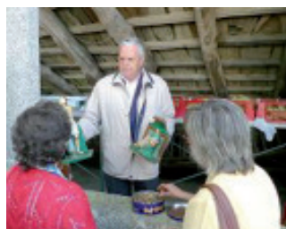
Ritual de «poñer o Santo» (Arcos - Outeiro de Rei).

Na actualidade, a perda de calquera animal, ligado dun xeito preferente co gando equino e vacún, segue sendo aínda un importante revés para a economía do campesino. Polo tanto, non resulta estraño apreciar como os labregos no intre actual seguen acudindo á Virxe e a outras entidades sacras, como intermediarios ou mediadores perante Deus, para acadar por medio da súa intercesión a curación da doenza. Sen embargo, ás veces da a sensación que estes mediadores teñen un poder primario, é dicir autónomo e autosuficiente para outorgar aquilo que se lles pide.