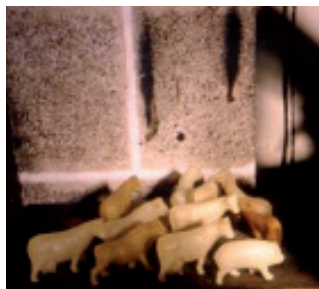
Exvotos de cera representando a diversos animais (O Cadramón, O Valadouro).

Actualmente este modelo é pouco usado. Só puidemos apreciálo nos santuarios da Nosa Señora do Faro en Requeixo (Chantada), da Virxe dos Milagres (Saavedra) (Begonte), da Virxe dos Desamparados nos Vilares (Guitiriz), do San Alberte en San Breixo (Guitiriz), do San Bento en Carballo (Friol).