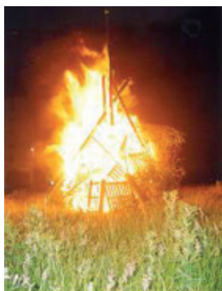
O Lume, como elemento profiláctico.

A auga bendita é un poder benéfico que se emprega para preservar á comunidade parroquial daqueles axentes negativos -climatoloxía adversa, entes maléficos- que poden alterar a súa orde. Equilibra os antagonismos e envexas locais reinstalando a orde moral na comunidade parroquial.