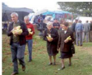
Devotos levando exvotos de cera arredor do santuario.

Na antigüidade xa se empregaban estes exvotos, aínda que eran de materiais diferentes. Así, no museo de Pontevedra hai unha sertie de terracotas procedentes do santuario itálico de Calvi, situado na Campania, onde se ofreceron moitos exvotos aos deuses itálicos ao longo de varios séculos. Hai que distinguir varias cabezas de homes e mulleres, así como algúns animais, como cochos e vacas. As máis destas terracotas, construídas con molde, estiveron policromadas, sendo interesante comprobar a súa semellanza cos exvotos de cera.