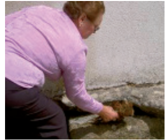
Devota deixando a crina do cabalo no sartego (Goiriz, Vilalba).

Esta ofrenda lévase a cabo preferentemente naqueles santuarios aos que acoden devotos ofrecidos por doenzas de animais. Principalmente consiste en queixos, cereais e algúns produtos do cocho, como poden ser unllas, linguas, cachuchas ou lacóns. No interior do santuario do San Adriano de Goiriz (Vilalba) hai un sartego, onde algúns romeiros seguen depositando nun buraco, que dá á parte exterior do recinto sagrado, as crinas dos cabalos; algúns devotos adoitan coller algunha crina do cabalo e levala para as súas casas cunha finalidade profiláctica. Este tipo de ofrenda séguena levando ademais algúns devotos nos santuarios do San Cosme en Galgao (Abadín), do San Alberte en San Breixo (Guitiriz) e do San Antón na Xestosa (Muras).