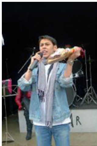
Ritual da poxa (Meilán, Riotorto).

Por outra banda, nalgúns santuarios, dedicados tanto ao San Antón Abade como ao de Padua, bastantes devotos levan de ofrenda produtos derivados do cocho, queixos, cereais e, ás veces, as crinas dos cabalos. Esta ofrenda en especie, que é poxada, ten un sentido específico, xa que estes santos están considerados a nivel popular como dos máis protectores da cabana animal.