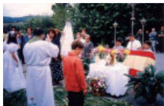
Bendición simbólica dos campos.

Esta práctica ritual queda reflectida tamén noutras comunidades galegas. « Los sebos de loureiros, muros vegetales que protegían la intimidad del centro doméstico, eran los que proporcionaban las ramas que se llevaban a bendecir a la iglesia el Domingo de Ramos...y que después, servían para confeccionar, el día de la Santa.Cruz, cruces para colocar en las leiras,y ante la puerta de la casa » 29 . Os chamados deuses da vegetación, as máis das veces están simbolizados baixo a forma de árbores. Cómpre lembrar a aciñeira sagrada de Zeus en Dodona, o loureiro de Apolo en Delfos, a oliveira silvestre de Herakles en Olimpia 30 . Polo tanto, a fecundidade e a saúde están concentradas nas herbas e nos árbores.