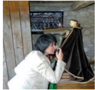
Devota bicando o manto do San Antón da Xestosa (Muras).

O San Antón de Vilabexe (As Nogais); festividade: o 17 de xaneiro e o 13 de xuño. O San Antón de Corvelle (A Pastoriza). O San Antón de Denune (Felmil) (Begonte); festividade: o domingo máis próximo ao 13 de xuño. O San Antón do Padornelo (Pedrafita); festividade: o 13 de xuño. O San Antón de Cortapezas (Portomarín); festividade: o 17 de xaneiro. O San Antón de Hospital (Quiroga); festividade: o sábado posterior ao 17 de xaneiro. O San Antón de Caspedro (Quiroga); festividade: o 17 de xaneiro. O San Antón da Cubela (Torbeo) (Ribas de Sil); festividade: o 17 de xaneiro. O San Antón de Trabada; festividade: o 13 de xuño. O San Antón da Rigueira (Xove); festividade: o 13 de xuño. O San Antón de Abeledo (Abadín); festividade: o 13 de xuño. O San Antón da Xestosa (Muras); festividade: o sábado e domingo non posteriores ao 13 de xuño etc.