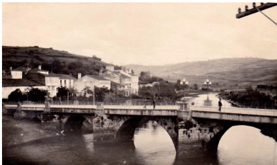
A Ponte Vella en 1932.

A ellos, Constantino y Severo, mis tíos bisabuelos, a quienes si acaso deba mi modesta afición literaria.