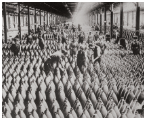
Mulleres nunha fábrica de municións.

No golfo Ártabro, esta precoz fuxida vivíase diariamente no porto de A Coruña, mentres que no de Ferrol, dependente dos investimentos militares, a contradición obreira entre as ideas pacifistas e o posto de traballo no Arsenal era patente. O ano 1914 foi botado o Jaime I, terceiro e último dos acoirazados contratados coa Sociedad Española de Construcción Naval, tras da que estaba a empresa inglesa Vickers, que xestionaba o estaleiro. Quedaban así cumpridos os encargos do I Programa de Rearme naval tras das perdas do 98.