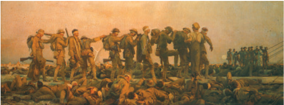
«Gaseados» de John Singer. Imperial War Museum, Londres.

The twentieth century, began to speak of disarmament and ended with military industry complex on the tops of economic power. Along the way, no less than 100.000.000 dead, of them, many more civilians than soldiers. Now, in the centenary of the Great War, we review some of the initial steps, some frustrated, some successful.