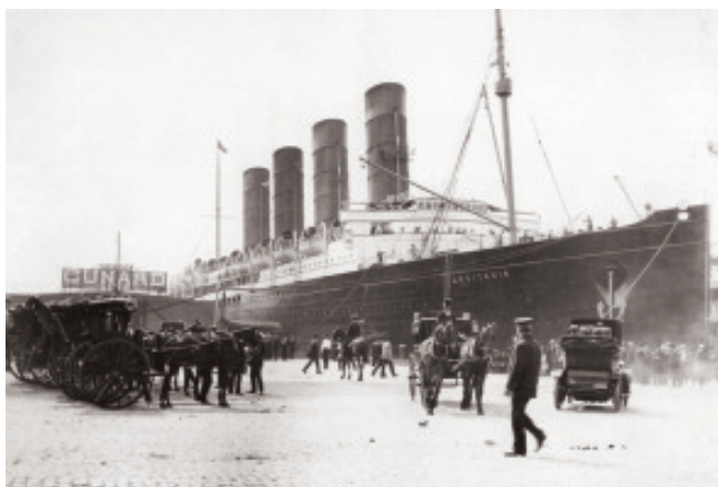
O Lusitania no peirao de Nova Iorque.