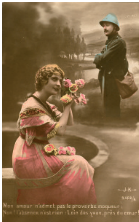
Postal en tempos da Gran Guerra. < http://www.sarahfrisk.net/Postcards FromTheGreatWar>

No 1916, véspera da entrada dos EE.UU. na Gran Guerra, realizouse unha película co seu argumento. Posteriormente no 1936 fíxose outra.