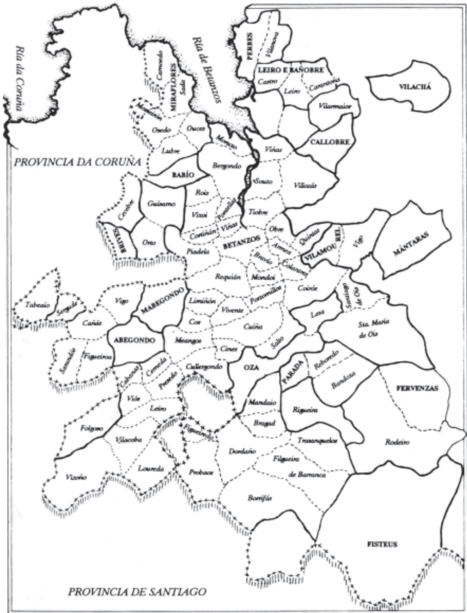
Imaxe 1: Mapa das parroquias da Xurisdición de Betanzos. Autores: Alfredo Erias e Xoán Miguel González. Publicado no Anuario Brigantino nº 12. 1989.