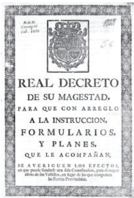
Imaxe 2: Portada do Real Decreto polo que se ordena a realización do Catastro de la Ensenada.

-Monxas Recoletas de Betanzos: 2 muíños: un situado na parroquia de Espenuca e río Mandeo con unha roda, e o outro na parroquia de Tiobre e río Caraña, tamén con unha roda e aforado.