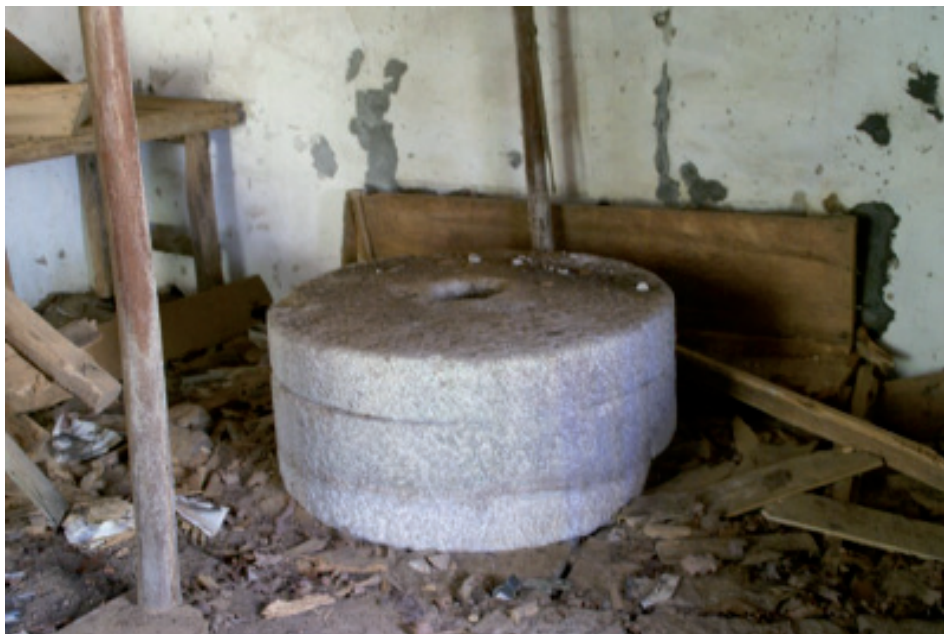
Imaxe 4. Pedras dun muiño hidráulico.