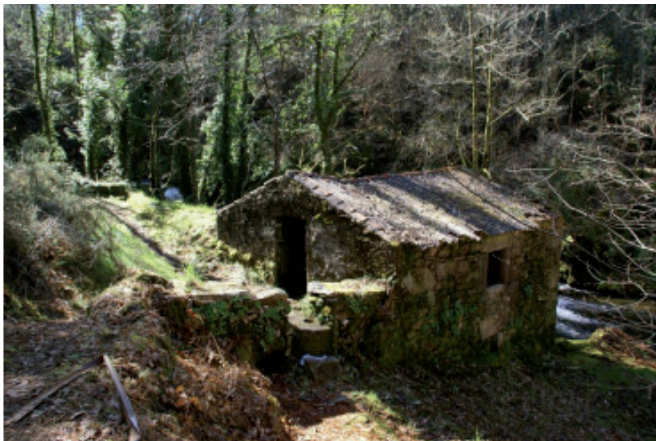
Imaxe 5. Ruínas dun muiño de herdeiros na parroquia de Santa María de Ois.

en Ciento y treinta y dos reales y la que lo haze solo seis meses en Sesenta y seis que ajuntan Ciento y Noventa y ocho Reales al año; y otro en el mencionado Coto de Gudín al sitio do Outeyro y arroyo da Freyria de una Rueda muele cinco meses del año perteneze al dicho marqués de Figueiroa, regulan su producción y utilidad en Sesenta reales también al año.