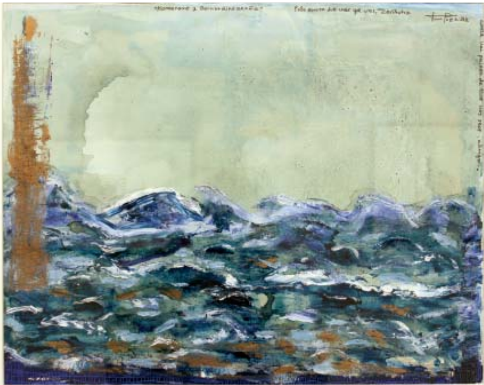
Obras de Tino Poza (2012).