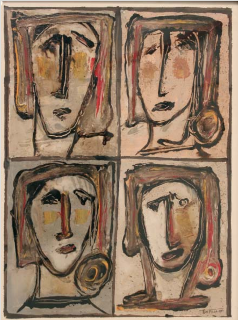
Obra de Tino Poza (2011).