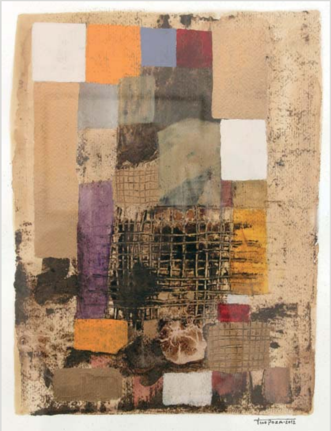
Obra de Tino Poza (2012).