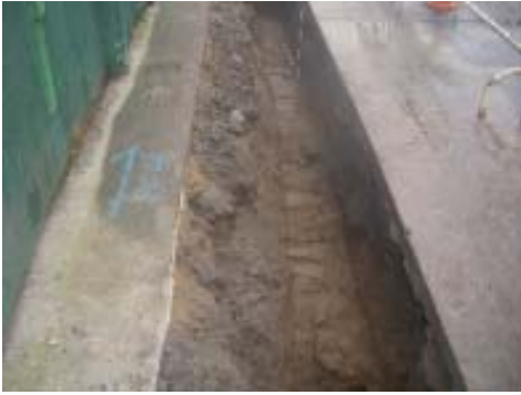
Vista da canle diante do n.º 44.