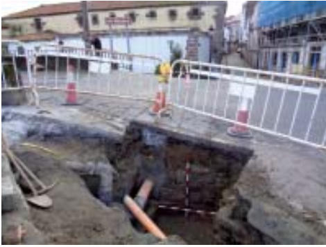
Perspectiva da localización do estribo.