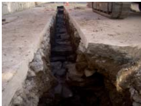
Vista do macizado dende o E.