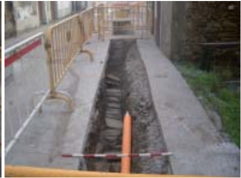
Vista da canle diante do n.º 48 e n.º 50

A segunda estrutura, segundo o noso punto e vista algo máis interesante atopámola na apertura dunha gabia perpendicular, que se abriu na praciña anteriormente citada, e enmarcada entre os números 50, 52, 54 e 56, pasando por diante da fachada lateral do n.º 56, a unha distancia de 125 cms.