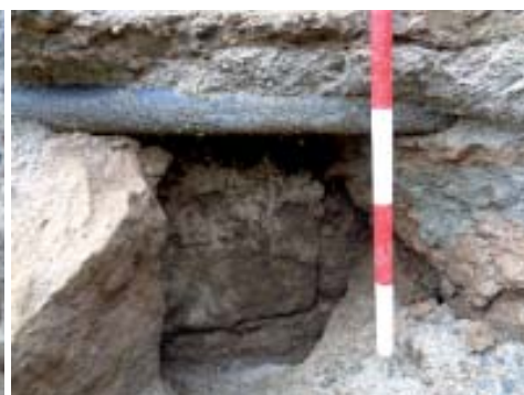
Paramento interior do muro do malecón executado en perpiaño no que a peza máis grande se corresponde coa basa da columna.

cara abaixo), mais si que apareceron tres chanzos da vertente sur. As bancadas ou chanzos consisten en bloques rectangulares alongados feitos en granito, asentados no aparello de lousas mampostas do machón.