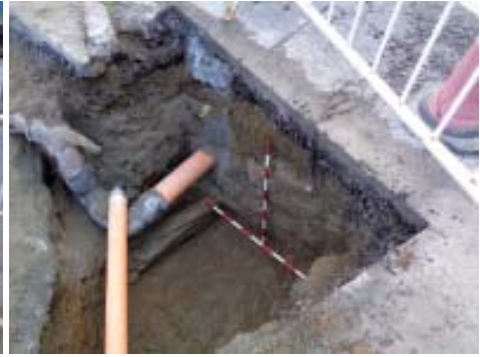
Detalle da localización do estribo.