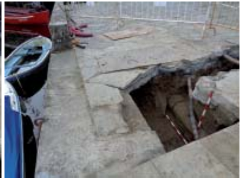
Vista comparativa da situación do antigo fronte do malecón respecto do actual.