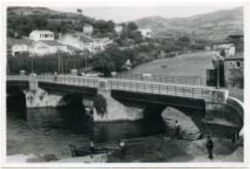
Antiga estampa da Ponte Vella.