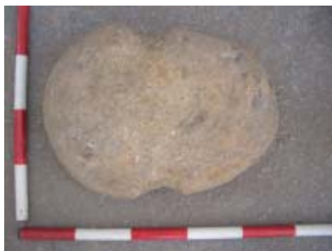
Vista de detalle do peso de áncora.

Cómpre indicar, asemade, que se puido comprobar como as pedras deste macizado parecen estar enlazadas coas que constitúen o muriño lateral «norte» da canle localizada neste tramo final da rúa Marina, o que indica unha simultaneidade temporal en canto á construción e uso de ambas as dúas.