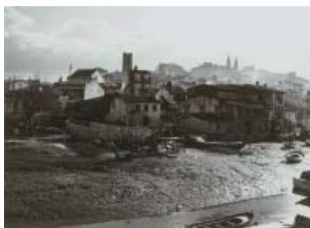
Peirao01. Vista do peirao e da carpintaría dos Bedoia en primeiro plano (1953).