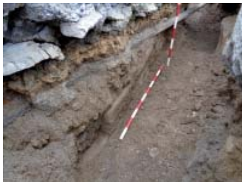
Vista de detalle da segunda escaleira documentada.