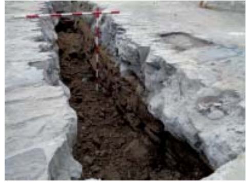
Vista de detalle do paramento exterior do muro do malecón.

Esta estrutura vese claramente nas estampas desta zona, tanto en fotos como en debuxo (litografía), polo que tampouco ofrece dúbidas.