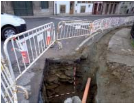
Perspectiva do muro de contención da estrada.