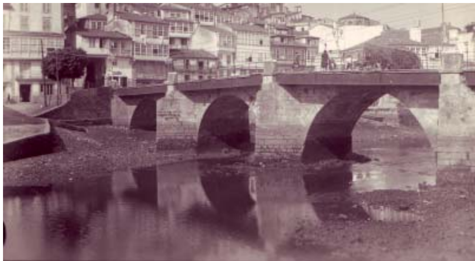
Antiga estampa da Ponte Vella.