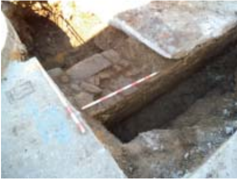
Vista de detalle da cimentación da edificación.