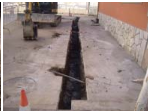
Vista do Macizado dende o O.