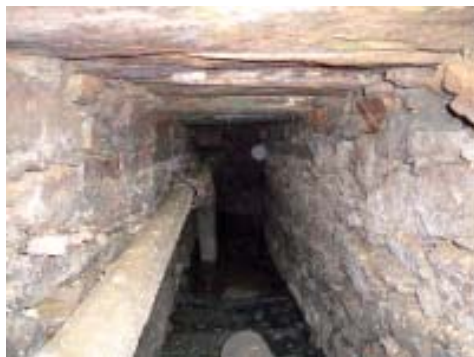
Detalle do interior da cloaca que descorre baixo a rúa do Alfolí.