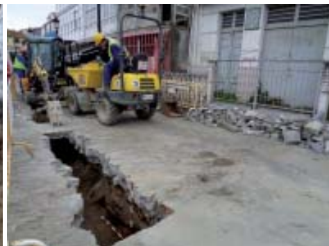
Vista en perspectiva da segunda escaleira fronte ao edificio «Alfolí 165».