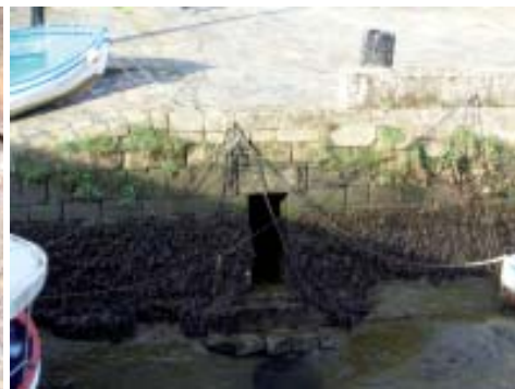
Desembocadura no Mandeo dunha galería de cloaca.

No que se corresponde coa praza do busto, non se documentan restos arqueolóxicos, mais nunha cata manual realizada na rúa do Alfolí, a pouca distancia da esquina do número 25, vemos a través dun pequeno oco do perfil do lado oeste o interior dun ramal de cloaca, que discorre baixo o asfalto da rúa. A estrutura, aínda en uso, resulta moi espectacular; a fábrica é moi elaborada (destácase a rectitude e perfección dos panos de muro, e as grandes lousas ou linteis que conforman as tapas da cuberta). Polo oco do perfil da cata conseguíuse obter as fotos, pero compre dicir que non apetecía meter moito o nariz, posto que no perfil (por baixo do asfalto) víanse furados e niños de rata, que non incitaba a explorar máis. Con todo na foto pode verse con bastante nitidez como o ramal de cloaca desemboca nunha galería principal, que se pode ver (cando está a marea baixa) como desauga no Mandeo por unha porta alta e alintelada, situada baixo o coroamento da rampla.