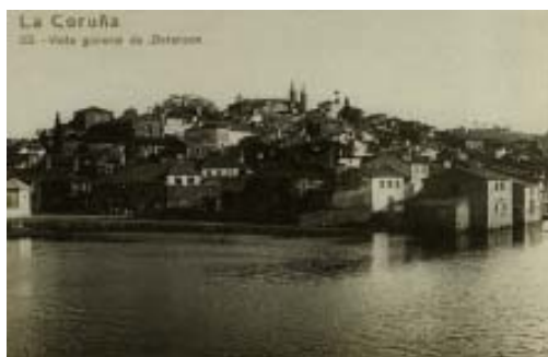
Peirao 02. Antiga vista de Betanzos e o peirao en primeiro termo.