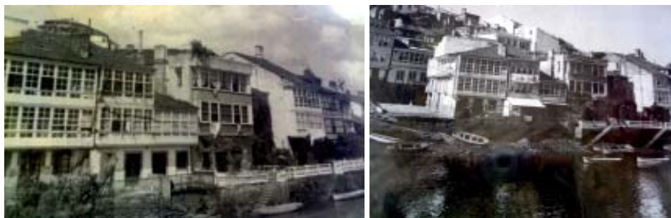
Vistas dos anos 60 da zona do Malecón próxima á Ponte Vella.