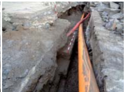
Vista de detalle dos banzos da escaleira.