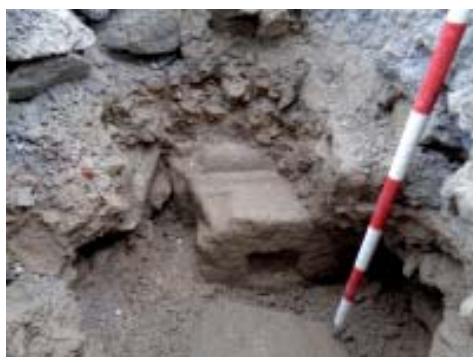
Detalle da basa da columna.