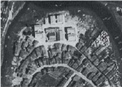
Vo americano 1956. Obsérvase a existencia da edificación.