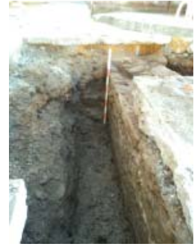
Vista de detalle da cimentación da edificación.