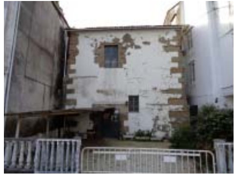
Vista do Alfolí na actualidade.

Imos pois a a sacar á luz esas vellas estruturas que quedaron en desuso e ocultas tras a construción, fai escasas décadas, do actual malecón. Como foi unha obra de realización relativamente recente (comentáronnos que se executou haberá arredor duns trinta anos) moitas persoas lembran perfectamente como estaba antes, e grazas a iso foinos máis doado ir poñéndoas en contexto.