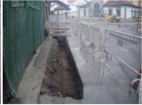
Perspectiva da canle diante do n.º 44.