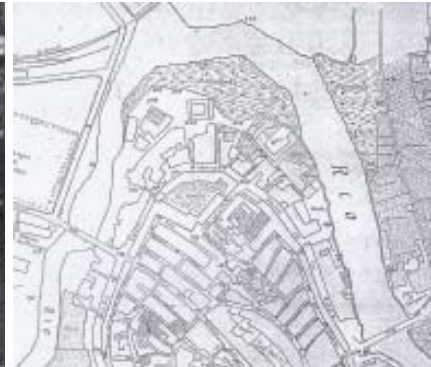
Plano dos anos 20 do século XX onde se observa a presenza da edificación e a configuración urbanística da zona do Malecón.

Continuando pola rúa Marina, situándonos á altura do emblemático edificio do antigo Matadoiro Municipal da cidade de Betanzos, polo seu lado sur, ábrese unha extensa praza pola que tamén se meteron os tubos do gas.