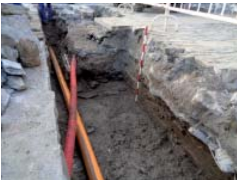
Vista do paramento do muro.

Así pois, á altura da medianeira 16/18 comeza a verse un tramo de paramento de muro feito con fiadas superpostas de aparello de lousas planas, con restos de morteiro de cal e area nas xuntas. Trataríase, pois, do lenzo da fronte do malecón da ribeira do río. A continuación, e enlazando co paramento, sobresa o machón dunha escaleira feito tamén en aparello de lousas. Consiste, como pode verse nas fotos antigas, dunha escaleira de dobre derrame que serve de baixada cara ao río. Na actualidade non se conservan os chanzos da vertente norte (polo menos os superiores, non sabemos se os hai dun metro