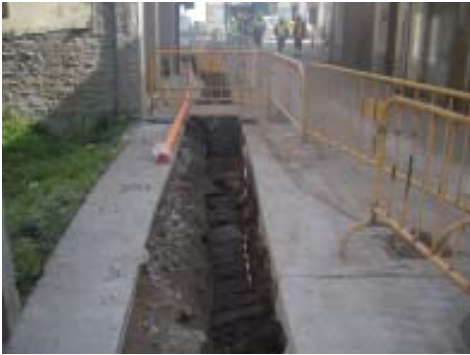
Vista en perspectiva da canle diante do n.º 48.