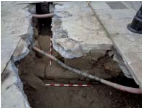
Vista xeral do desenrolo do muro do malecón en anchura e lonxitude cos elementos de amarre de embarcacións incrustados no perpiaño.