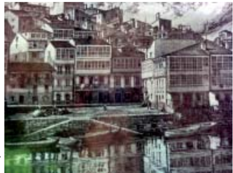
Litografía do malecón na zona das tomas fotográficas da actual intervención.