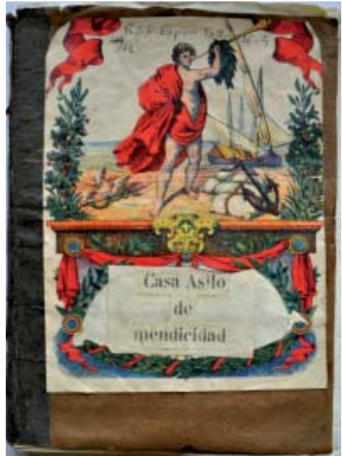
Carpeta coas notas sobre a Casa Asilo de mendicidad (USC-BX: RSE. Espino).