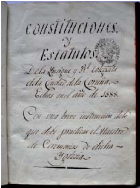
Copia das Constituciones y Estatutos de la... colegiata de la ciudad de la Coruña , 1588 (USC-BX: RSE. Espino).

cado por María Virtudes Pardo Gómez: Biblioteca Universitaria de Santiago de Compostela: Catálogo de manuscritos da Biblioteca Xeral (Santiago, 1998, pp. 145 a 155). Todos están escritos en castelán e, agás poucas excepcións, sempre se refiren á súa cidade natal: