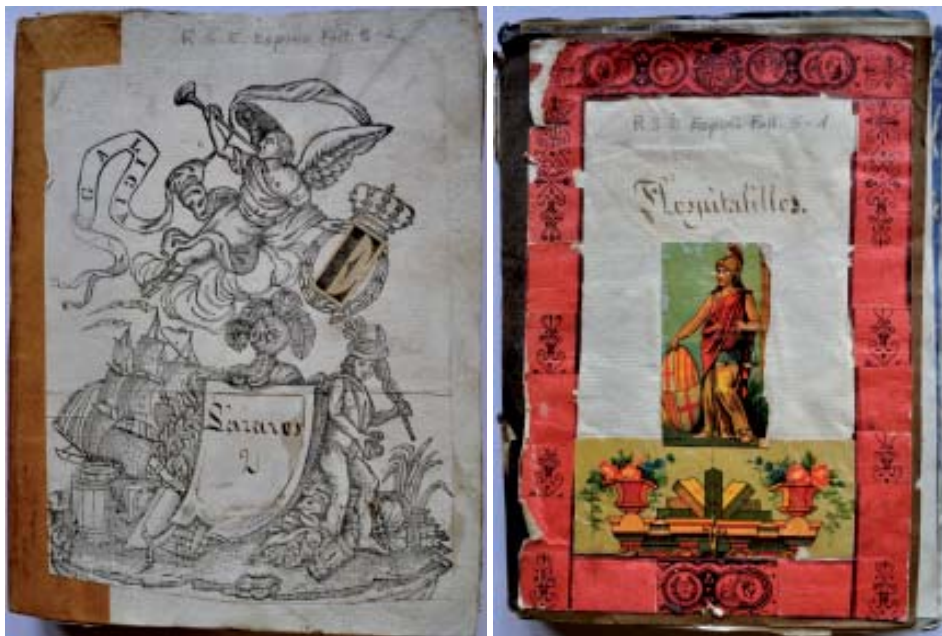
Apuntamentos de Espino Rodríguez: «Lázaros» e «Hospitalillos» (USC-BX: RSE. Espino).