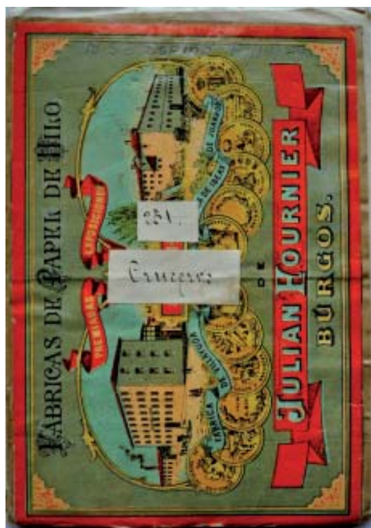
Cuberta do manuscrito dos cruceiros composteláns (USC-BX: RSE. Espino. FOLL 4/4)-

Esta sociedade foi quen herdou os seus papeis por decisión testamentaria asinada o 28 de febreiro de 1896: