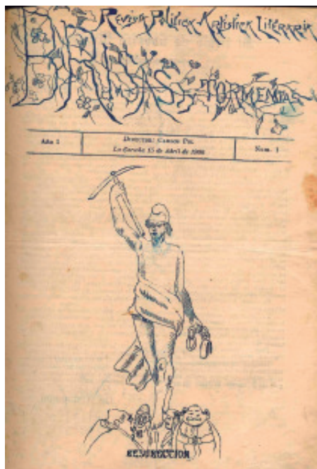
Portada do semanario Brisas y Tormentas .

Un mes despois, o Gran Mestre, en nome da Soberana Gran Logia Simbólica Española, «dá las más expresivas gracias al Ven., Ddig.: y Oof.: de la Logia «Amor Universal, núm. 32», de Ordenes (Coruña), por el cuadro fotográfico que de los mismos se ha recibido con atenta dedicatoria». 68