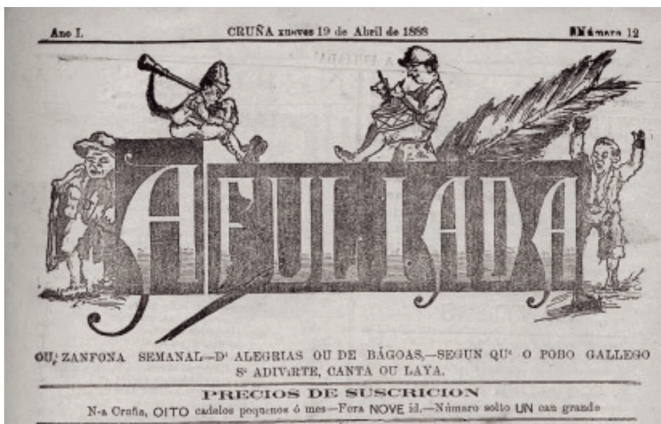
Cabeceira de A Fuliada . da «Cruña».