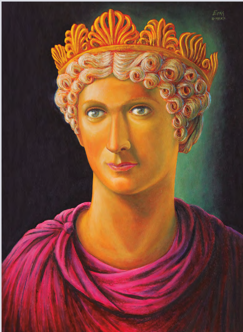
IULIA AGRIPPINA AUGUSTA, Agrippina Minor (7-11-15 // 19 ou 23-03-59, imperatriz de Roma: 49-54) irmã de Calígula, esposa e sobriña de Claudio e nai de Nerón