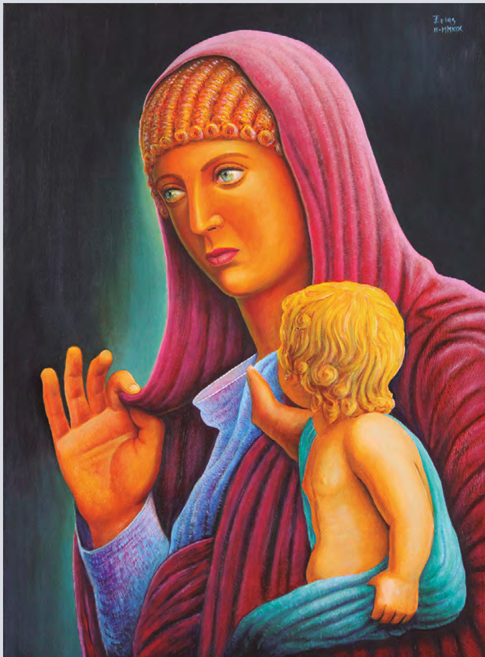
Valeria Messalina (25-48 dC, emperatriz de Roma: 41-48) 3ª esposa do emperador Claudio