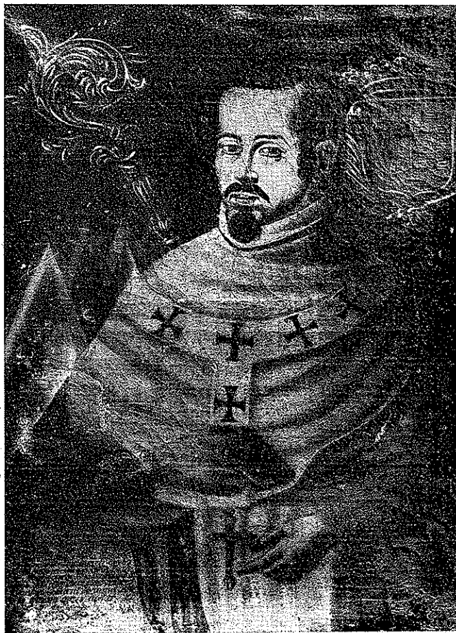
Don Francisco de Aguiar Seijas y Ulloa,

arzobispo de Méjico, legado a látore del Sumo Pontífice en este país y apóstol de las Indias occidentales.