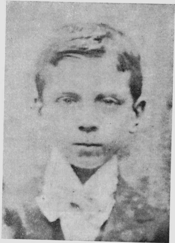
Vales Villamarín de neno

e bibliotecario. Realizou diversas investigacións históricas nos Arquivos Nacionais de Valladolid e Simancas, pensionado pola Diputación Provincial da Cruña e o Concello de Betanzos. Foi vogal da Sección Provincial de Selección e Protección para Ensinanza Superior e Media, designado polo director xeral de Ensinanza Superior e Media. Foi redactor do diario "Gaceta de Galicia", de Santiago, e de varios semanarios brigantinos.