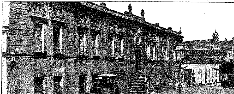
O Edificio Arquivo en Betanzos

postura, posto que puña en perigo a decisión tomada (19).