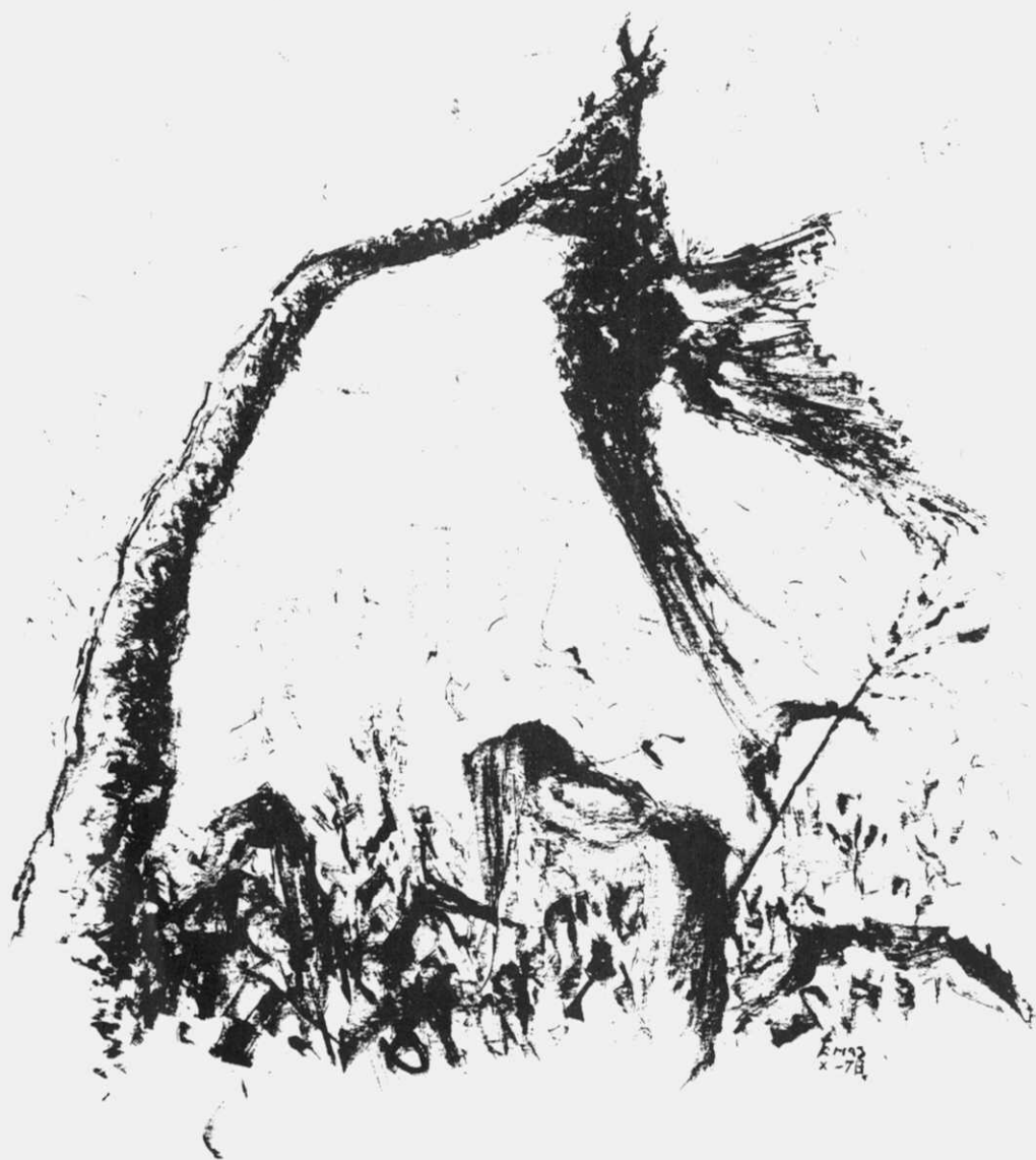
O corvo da Agra dos Pampillos. Debuxo de Erias.