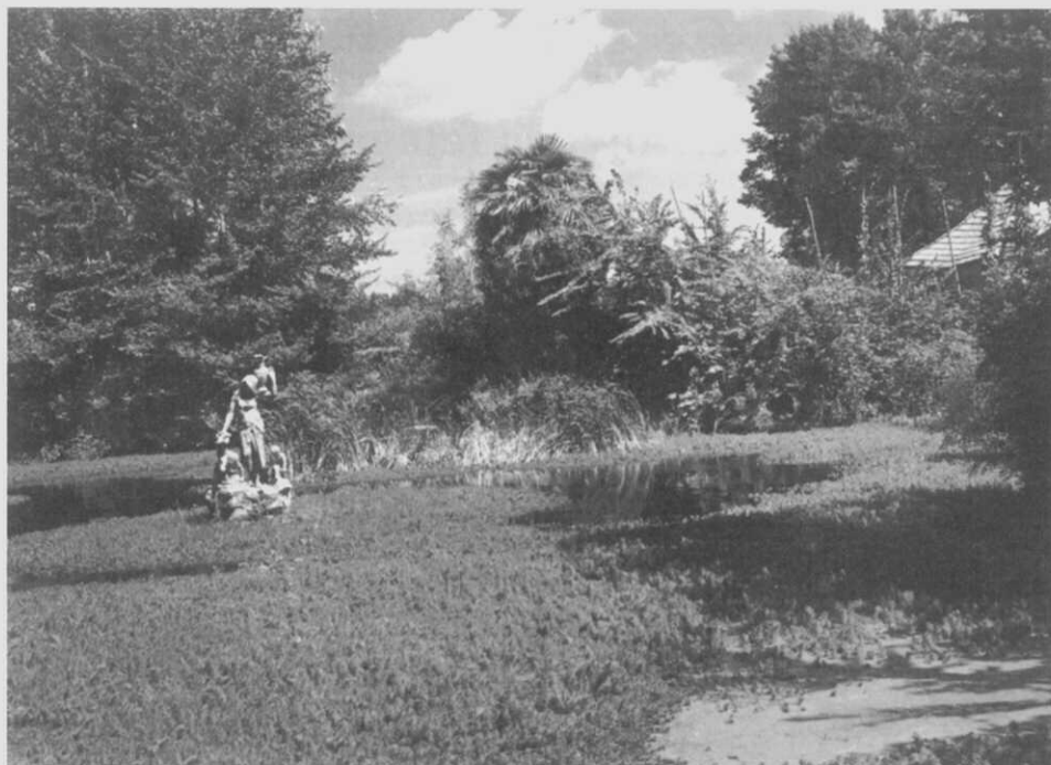
El Estanque de los Papas en ruinas. Hoy no existe.

Abajo, a la izquierda, edificio sobre el Río Mendo. A la derecha, la estatua de la Caridad.