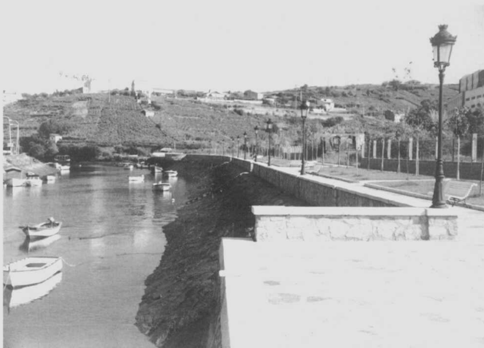
Dos vistas del Malecón del Puente Viejo, antes y después de la construcción del puente de madera.