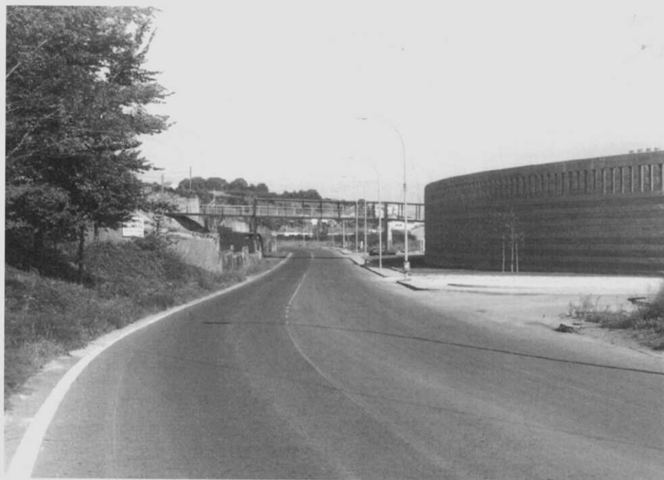
Dos vistas del Pasatiempo en la actualidad.