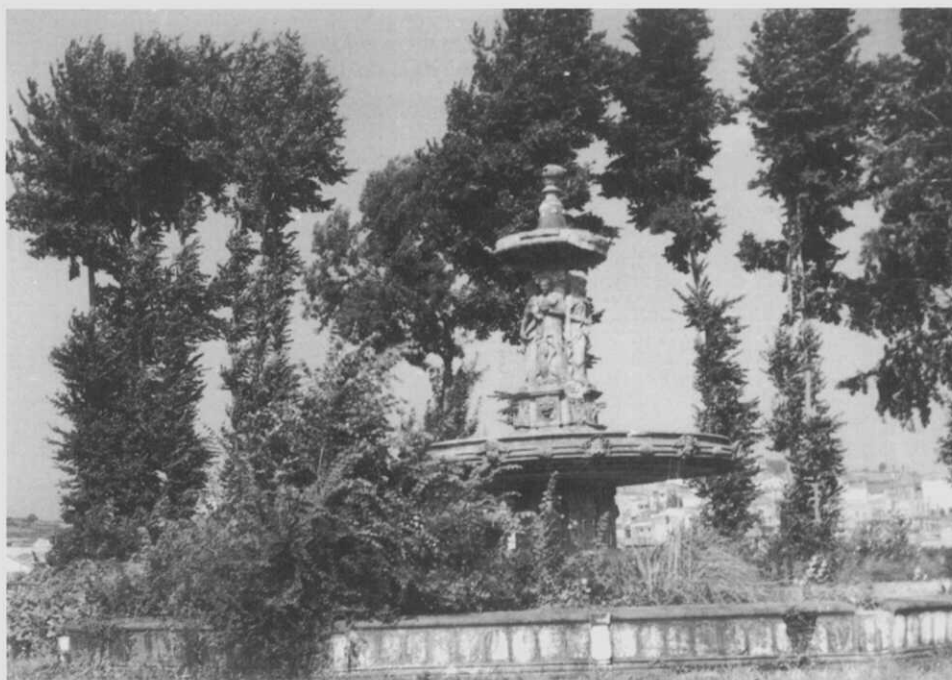
La Fuente de las Cuatro Estaciones, hoy todavía superviviente.