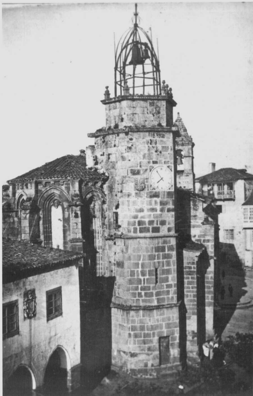
Torre do Reloxo e Igreja de Santiago antes de 1900.