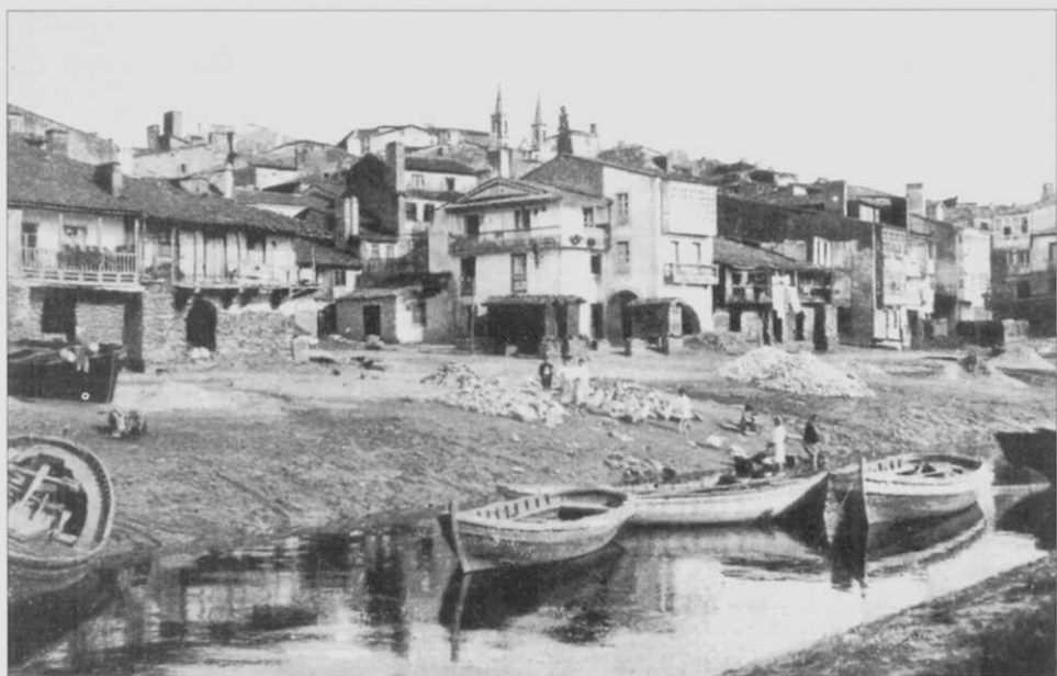
Imaxe do "Peirao" de Betanzos nas primeiras décadas do s. XX.