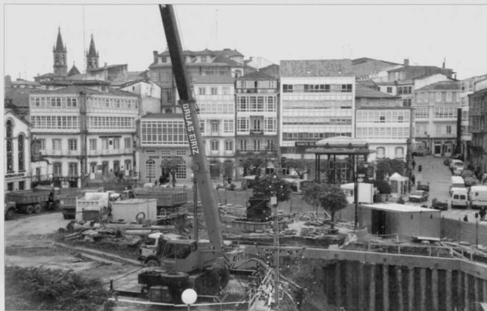
Dúas imaxes da Praza dos Irmandiños ("O Campo"): a de arriba, de xuño de 1996, e a de abaixo de comezos do ano seguinte.