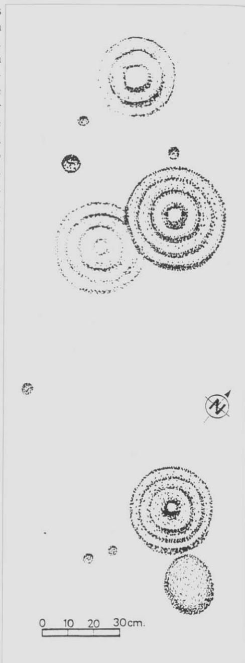
Fig. 2.- Vista xeral do petroglifo de Chamorro.

Tralos primeiros traballos de inspección, logramos ter unha idea bastante precisa do que ía asomando pouco a pouco ante os nosos asombrados ollos: o conxunto rupestre estaba composto de circos concéntricos