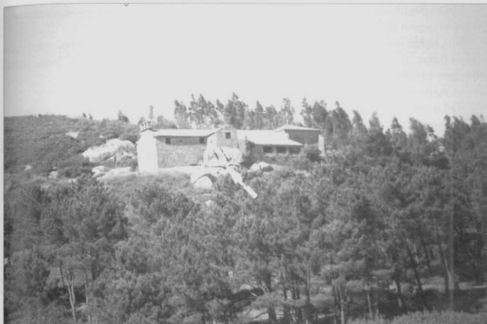
Fig. 3.- Vista xeral da ermida de Chamorro coa ubicación do outeiro (altar) con petroglifo.

e coviñas, presentando unha máis grande preto do extremo leste (figura nº2); por fin iámonos achegando, atopabámonos ante un outeiro (de altarium , altar; véxase traballo de D. Luis Monteagudo neste Anuario Brigantino ), pero ¿de que tipo? ¿de que época?; temos que seguir investigando, e a tarefa non é doada por estar incompleto o devandito altar a causa da grave erosión.