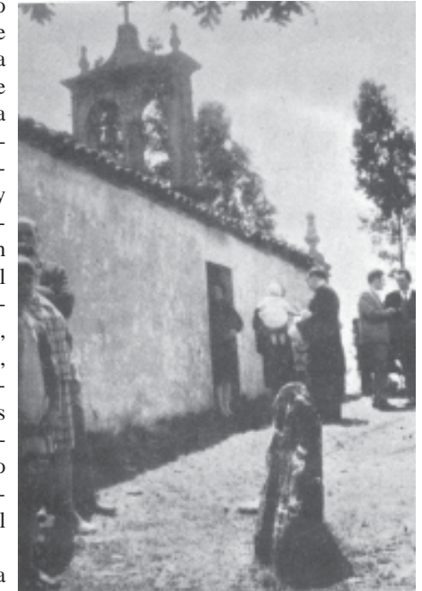
Fig. 1.- CESURAS: El soporte dolménico del pico da Medela.

El expresivo orónimo -Medela- nos ha hecho pensar mas de una vez si el mismo estaría relacionado con la existencia de alguna sepultura dolménica en aquella elevada cumbre, cosa que tuvimos ocasión de comprobar un día de «romaxe» 1 , al celebrarse allí, como de costumbre, la festividad de