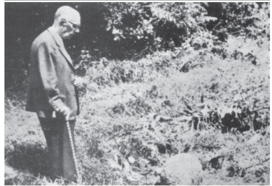
Fig. 3.- LARAXE: El autor de este trabajo ante el llamado "marco de San Lorenzo". "El dolmen se hizo altar", frase de un ilustre escritor contemporáneo que podemos aplicar aquí perfectamente.

Y Fabal refiere que los enfermos cogen nueve piedrecitas en una encrucijada y puestos ante la laja van tirando cada una de ellas por encima del hombro izquierdo, recitando de paso: «Tanto goce de mín quen me queira mal, como eu gozo desta pedra. Un padrenuestro e unha avemaría polo poder de Dios e da Virxe María». Algunas veces son tres las personas que deben verificar la ofrenda, habiéndose comprometido Fabal en diversas ocasiones a completar el grupo cuando se estimó necesario. Como nuestro hombre vive en las cercanías del «esteo», recoge con frecuencia el dinero que en él aparece, llevándolo seguidamente a la parroquia y depositándolo en sus boetas. 7