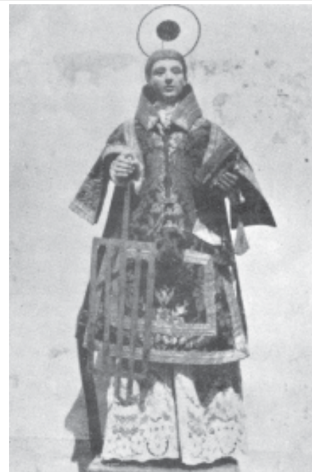
Fig. 2.- LARAXE: La imagen de San Lorenzo procedente de la desaparecida capilla de este nombre, ataviada con flamantes ornamentos para dar más empaque a la modesta talla. (Foto José Antonio Veiga Sánchez).