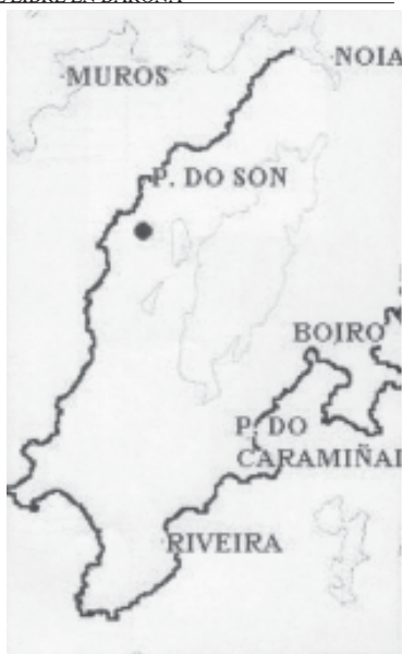
Fig. 1.- Plano xeral de situación do petroglifo na península do Barbanza.

Partindo da igrexa parroquial de Baroña hai que coller unha pista estreita pero ben asfaltada que vai cara os lugares de Vilar e A Arnela, e que sae á esquerda da praza que na parte posterior da igrexa. Aproximadamente a 400 m. por esta pista atopamos unha curva pronunciada desde a que é moi visible un depósito de auga existente na propia ladeira, uns 100 metros máis abaixo de onde nos atopamos. Baixamos ata o depósito e deixándoo á nosa esquerda camiñamos uns 70 m. en dirección noroeste ata a zona onde a ladeira é máis escarpada. Aquí, na parte inferior dunha rocha case vertical de boas dimensións, atópanse os gravados.