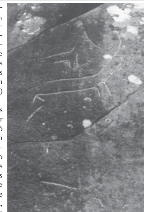
Fig. 2.- Petroglifo de Baroña. Vista xeral.

O feito de que se escollera unha rocha plana e case vertical, situada na zona media da ladeira do monte e cun punto de vista privilexiado cara ó seu entorno entra dentro das convencións sinaladas por Vázquez Rozas 10 para as rochas nas que aparecen gravados motivos animalísticos. Non é posible constatar, sen embargo, as hipóteses de Bradley,