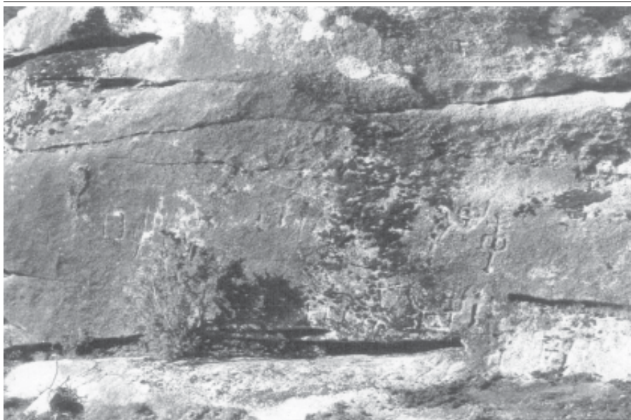
Fig. 3.- Vista de conxunto do petroglifo de Gourís.

do home, existen polo menos outras 10 que presentan unha ampla marxe de dúbida e ben puideran ser froito da erosión da rocha e aínda é posible que existise algunha figura máis hoxe practicamente desaparecida.