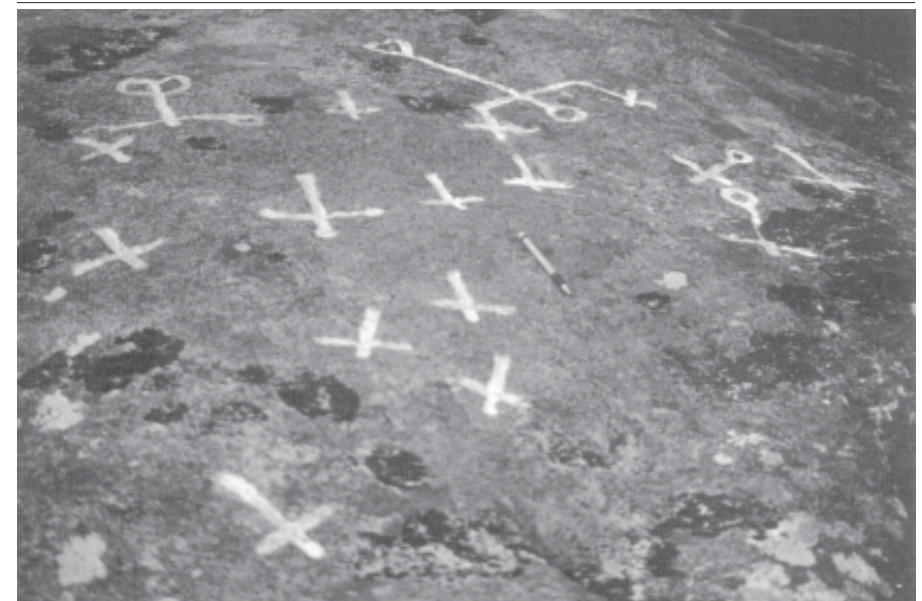
Fig. 4.- Petroglifo de Pedra Leirada (Pobra do Caramiñal).

ce sempre gravada con suco moi ancho e de fondo plano, mentres que os elementos que supostamente lle foron engadidos con posterioridade están insculpidos cun suco de perfil en V bastante pechado, máis profundo en relación coa súa anchura.