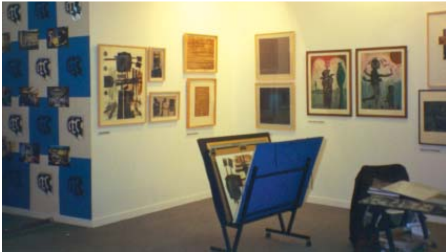
Stand del CIEC en la Feria de Estampa, Madrid, noviembre 1999.