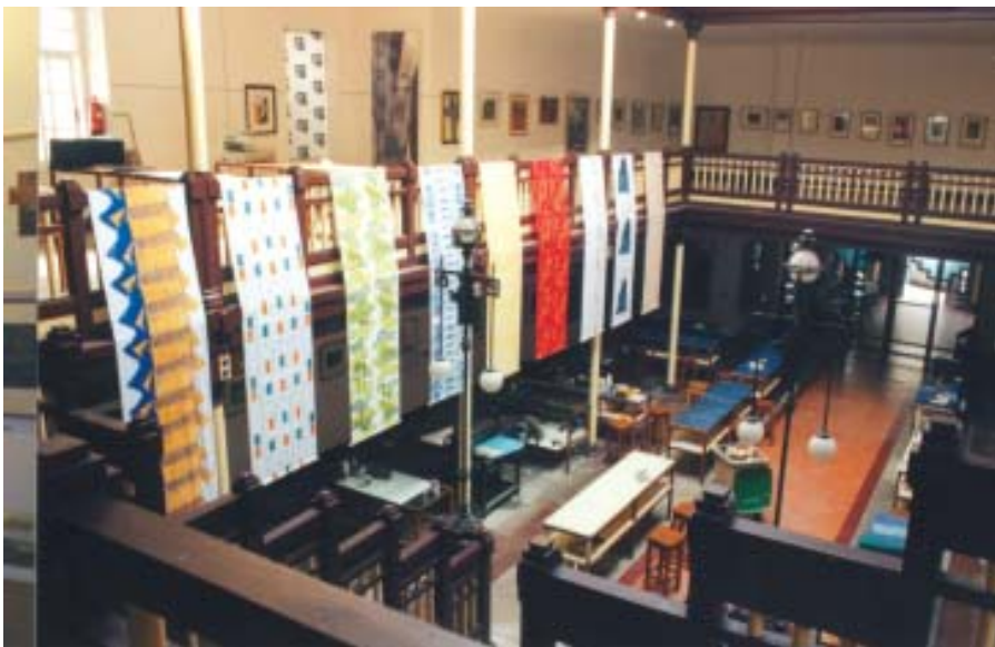
Anuario Brigantino 1999, nº 22

En definitiva, después de más de quince años desarrollando un importante esfuerzo en la labor de formación y difusión del arte del grabado, la Fundación CIEC con este programa de actividades y proyectos que acabamos de presentar, pretende ser una apuesta factible, seria y cercana en favor del arte gráfico en Galicia.