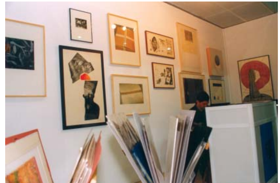
Stand del CIEC en el Foro Atlántico de Arte Contemporáneo, Pontevedra, octubre, 1999.