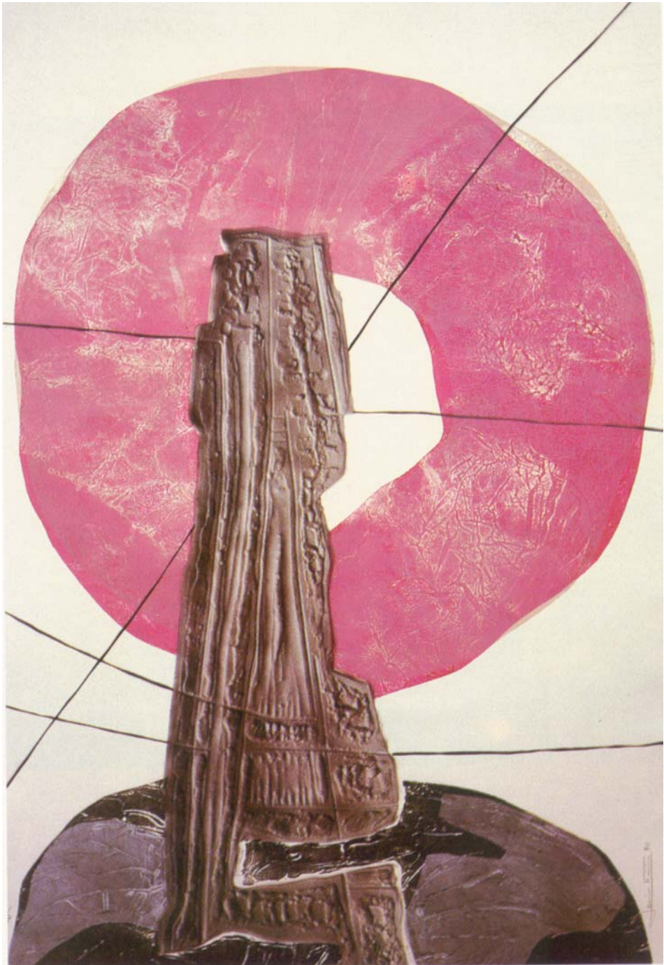
Jesús Núñez: PASO DE ALMANSUR. 1990. Xilografía - litografía - aditivos. Mancha: 76x110 cm. Papel: guarro Super Alfa. Matrices: 5. Tirada: 7.