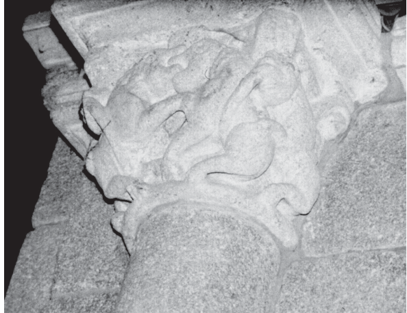
Fig. 7.- Capitel del lado norte del ábside central de Bergondo.

Es preciso señalar, llegado este punto, que en lo que se refiere al alzado de los muros, norte, sur y oeste , principalmente, se van a apreciar numerosas referencias que hablan, sin lugar a dudas, de intervenciones posteriores en la mayor parte del edificio; así por ejemplo no puede pasar desapercibida la poca presencia de vanos que ofrece el conjunto edilicio, ninguno en el