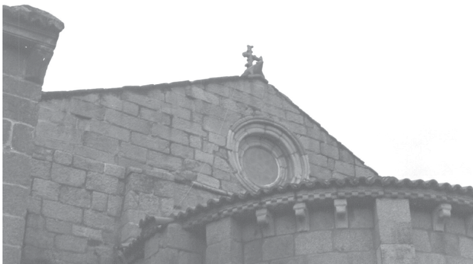
Fig. 13.- Cruz antefija de Bergondo.

La función funeraria de la Capilla queda perfectamente configurada con las representaciones animalísticas y el Jano Bifronte, pero para remarcar aun más esta función, la Capilla está dedicada a Santa Catalina, aludiendo así a la figura del mártir, el cual con la fortaleza de su fe, completa el mensaje que advierte al fiel sobre el camino que debe seguir para alcanzar el Paraíso en el fin de los días. Similar lectura, tiene la portada norte de la Colegiata de Santa María del Campo de A Coruña 68 , donde ya no la advocación, sino la representación del martirio de Santa Catalina, indica al espectador sobre la necesidad de la Fe y de llevar una vida piadosa para alcanzar la Gloria.