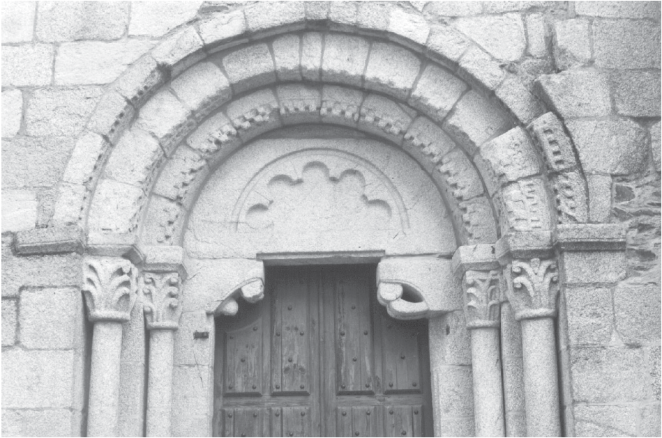
Fig. 3.- Detalle de la portada occidental de Bergondo.

había ordenado que los monasterios cuyos fundadores hubiesen sido reyes o antecesores de ellos, se les desembarquen las haciendas que los caballeros tenían usurpadas. Comenzó a unir este monasterio a San Martín de Santiago por fray Pedro de Nájera, reformador, año de mil y quinientos, por autoridad apostólica; pero no se expidieron los despachos ni se puso en ejecución lo que estaba ordenado por algunas demandas y respuestas que hubo por parte de fray Juan de Manzaneda, último abad de San Salvador. Pero renunciando éste el año de mil y quinientos y nueve en manos del abad de San Martín, fray Arias de la Rosa, se concluyó esta anexión y después la confirmó el Papa León X, año de mil y quinientos y diez y siete 19 .