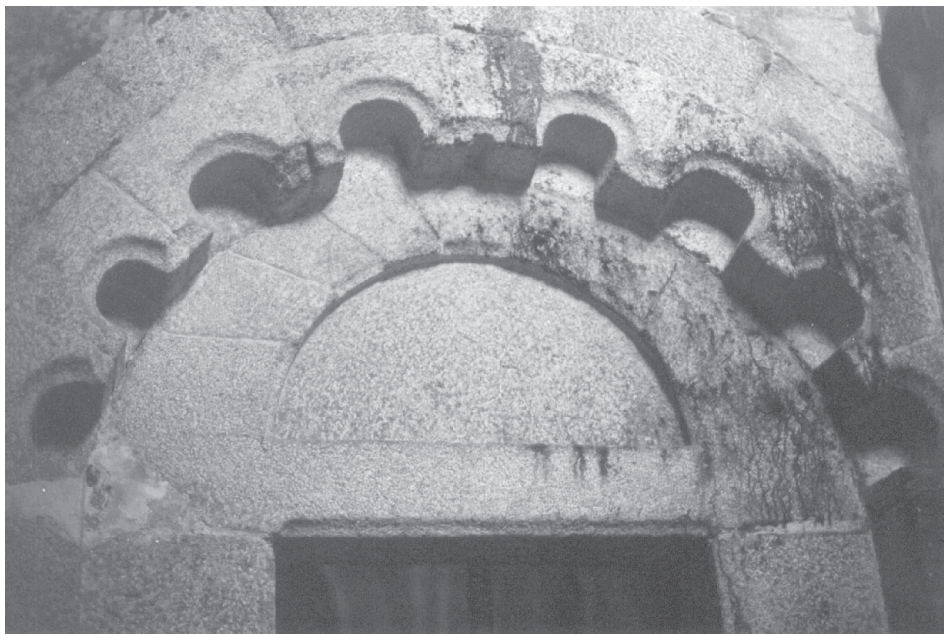
Fig. 6.- Vista de la Porta Sur de Bergondo.

por lo que este dato podría servir en Bergondo para datar una intervención en la parte alta del edificio y quizá también en la Capilla de Santa Catalina, que para algunos autores es la base que confirma la noticia que daba P. Yepes acerca del incendio de 1338. Pero quizá se trata en este caso de una reforma impulsada por el nuevo gusto imperante a partir de fines del XIV y principios del XV (Gótico), o como pago a los numerosos conflictos que existían entre Bergondo y la familia Andrade.