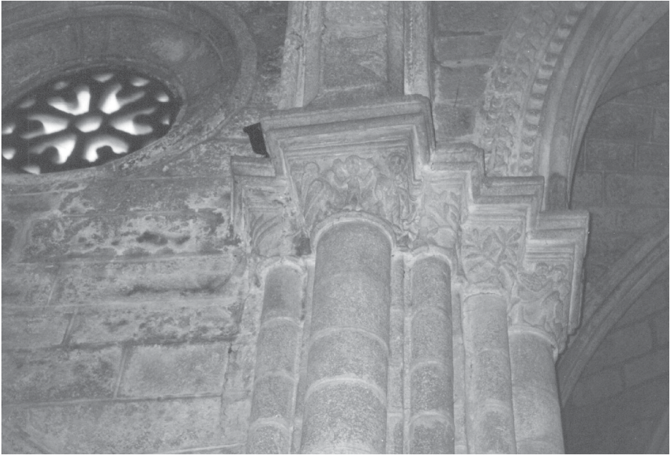
Fig. 12.- Capitel del presbiterio de Santa María do Azogue (Betanzos).

ser de aves, tal vez se está representando unas harpías que comparten la misma cabeza. Enfrente otro mascarón que son dos cabezas unidas por los pómulos (nº 4), que presenta un nivel de erosión bastante importante. Esta representación bifaz es muy similar a la que se encuentra en otras dos iglesias relacionadas con Bergondo por el patronazgo de Fernán Pérez de Andrade. En la Iglesia Parroquial de Santiago de Betanzos se puede apreciar una figura de doble rostro en una ménsula de la cabecera (principios del siglo XV), y en el capitel del lado derecho del ábside sur de la iglesia de Santa María de Azogue 64 (1380-1390). Esta imagen se identifica como Jano Bifronte, dios romano representado con dos rostros contrapuestos en la misma cabeza, mirando simultáneamente delante y atrás. Dios cuyo carácter vigilante se entendía aplicado siempre según la ambivalencia que era su rasgo principal: interior y exterior, pro y contra, Bien y Mal, principio y fin 65 . Precisamente esta ambivalencia entre principio y fin es la que da el significado de la pieza en estos casos concretos, y lo que permite establecer claramente una relación iconográfica y de funcionalidad entre Santa María de Azogue y la Capilla de Bergondo. En la primera representaría el mes de enero (principio y fin del año), formando parte de un ciclo que representa los meses como metáfora del camino de la vida humana, lo que junto a las representaciones animalísticas alusivas al pecado, completaría el mensaje de transitoriedad