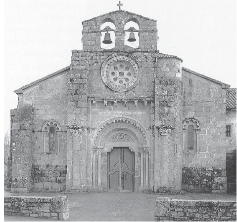
Fig. 2. Vista de la portada occidental de la iglesia de Cambre.

Tiene además esta iglesia siguiendo, según es la tradición, la serie y denominación de los 72 discípulos de Cristo, 72 canónigos que siguen la regla de San Isidoro, doctor de la iglesia española. Entre ellos se reparten por semanas las ofrendas del altar de Santiago. Se dan al primero las de la primera semana, al segundo las de la segunda, al tercero las de la tercera y así sucesivamente hasta el último. Cada domingo, según cuentan, se dividen las ofrendas en tres partes, la primera de las cuales las recibe el canónigo de turno. Los dos tercios restantes se vuelven a dividir en tres partes; una para sustento de los canónigos, otra para la fábrica de la basilica y la tercera para el obispo 13 .