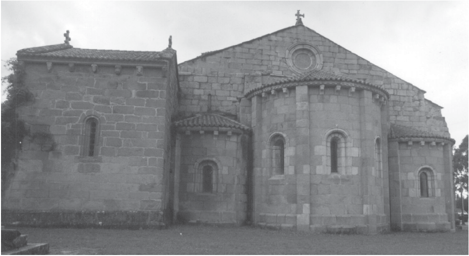
Fig. 4.- Vista general de la cabecera de Bergondo.

Con este sometimiento, el monasterio adquiere el carácter de Priorato que persiste hasta los tiempos de la exclaustración. Esta dependencia supone, sin duda, el principio del fin para el monasterio y para su comunidad, ya que provoca la disminución del número de monjes y la preocupación no por el propio monasterio, sino por la Abadía de la cual depende, lo que da lugar al decaimiento y posterior abandono del edificio.