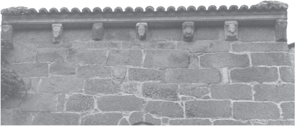
Fig. 15.- Exterior de la capilla de Santa Catalina, de Bergondo.

altura en las propias arquivoltas, signo evidente de que se ha perdido parte de la fábrica original.