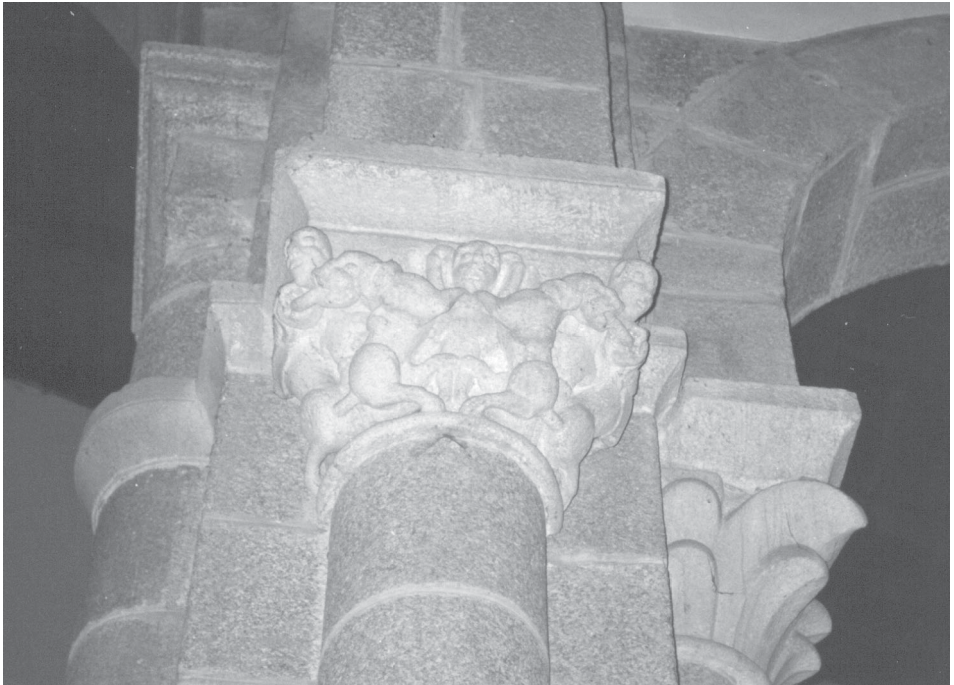
Fig. 10.- Capitel de la nave de Santa Mª de Cambre.

que adquieren las piernas dobladas nos aproxima a ejemplos betanceiros como es el caso del tímpano de la puerta norte de la iglesia de Santa María de Azogue -se da para esta obra una cronología de 1380 a 1390 54 -, que presenta una Psicostasis (peso de las almas), en la cual la representación del difunto se arrodilla empleando la misma solución que se observa en Bergondo, lo mismo que en la portada occidental de la Iglesia de San Nicolás de Cís , obra de cronología similar y geográficamente muy próxima. (Véanse figs. 11 y 12)