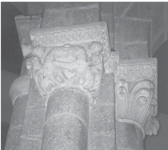
Fig. 8.- Capitel de la nave de la iglesia de Santa M a de Cambre.

Este mismo soporte también tiene presencia en el muro exterior del testero en línea con los extremos del ábside central. Esto resulta fundamental, puesto que habla de un cambio llevado a cabo en ese muro. En el, se refleja la primitiva altura de la techumbre, que llegaría hasta el remate de ese pilar, con lo que su aspecto sería parecido al que presenta actualmente la