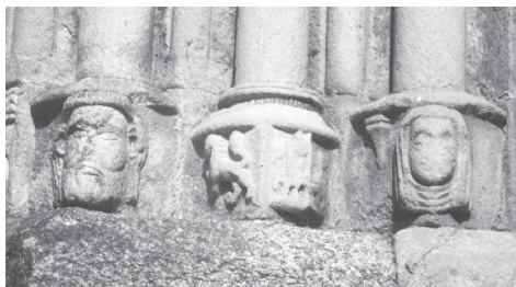
Fig. 16.- Detalle de las basas de San Francisco de Betanzos (portada occidental).

Esta noticia sorprende en primer lugar porque ningún otro autor menciona esta posibilidad, y por otro, porque la situación de la supuesta inscripción no es la más habitual, ya que normalmente se disponen en el tímpano. Pero Vaamonde cuenta en su favor, que su pueblo natal es San Juan de Ouces (1867), parroquia muy próxima a Bergondo, por lo que le permitiría conocer de primera mano este edificio y los cambios que en él se diesen. Además A. del Castillo, en 1915, habla de: