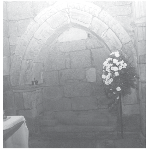
Fig. 17.- Sepulcro del ábside central de Bergondo, muro norte.

De nuevo, las desafortunadas intervenciones realizadas en el edificio, privan al conjunto de la imagen con la cual fue diseñado, y dificultan su comprensión en la actualidad, ya que se trata de intervenciones agresivas y que no permiten la fácil distinción entre lo original y lo añadido.