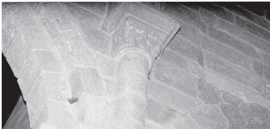
Fig. 11.- Capitel del primer tramo de la nave del muro sur de Bergondo.