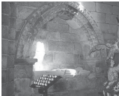
Fig. 18.- Sepulcro del transepto de la iglesia de San Francisco de Betanzos.

arco aparece un Ángel con cartela en el lado izquierdo (Arcángel San Gabriel), y a su lado una Virgen María 78 , que presenta una disposición muy similar a la vista en la parte alta de la nave central, apoya su mano derecha en el pecho y en la izquierda porta un libro. Es fácil de identificar la escena como una Anunciación, que ya fue analizado en profundidad anteriormente. El resto de dovelas resultan algo problemáticas. Son un total de cuatro y tres de ellas no parecen ser originales. El motivo que albergan todas ellas son parejas de palmetas carnosas sobre dos molduras talladas en nacela que se colocan afrontadas. La afirmación sobre la dudosa autenticidad de tres de ellas se debe a que el