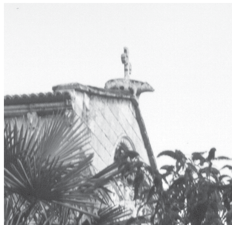
Fig. 14.- Antefija de San Francisco (Betanzos).

La portada principal de Bergondo se abre entre dos contrafuertes centrales, que son los que marcan el ordenamiento de la misma, ya que condicionan la situación de los elementos que la configuran. Estos dos pilares, de importante sección cuadrangular, tienen un remate escalonado muy característico, que es preciso datarlo en la campaña llevada a cabo entre el último tercio del XIV y principios del XV. Este rasgo tan Gótico también se aprecia en los contrafuertes presentes en los muros laterales, con lo que se mantiene ese ritmo armónico de la construcción. Este elemento no es algo novedoso, ya se había empleado en otras iglesias de Betanzos vinculadas con los Andrade como San Francisco de Betanzos -1387- o Santa María de Azogue -1380 y 1390-. (Véase fig. 1)