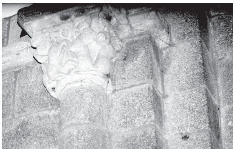
Fig. 9.- Capitel del lado sur del ábside central de Bergondo.

Los laterales, más sencillos, presentan un arco de ingreso de medio punto doblado que se apoya en sendos pares de columnas adosadas, de basas áticas que presentan garras en sus ángulos y cuyos capiteles se decoran exclusivamente con elementos vegetales. De los cuatro capiteles, tres presentan una tipología común, dos hileras de hojas lobuladas, que se vuelven hacia fuera y que algunas de ellas albergan en su interior una serie de bolas, todos ellos muy semejantes a los que decoran el segundo tramo de la nave central de Santa María de Cambre, o a los que se representan en iglesias betanceiras como: San Martiño de Bravio 47 (capitel norte del ábside triunfal) o Santiago de Reboredo 48 (capitel norte del arco triunfal), y que remiten a las formas empleadas en el deambulatorio de la Catedral Compostelana 49 . El otro modelo de capitel presenta una única hilera de hojas más estilizadas, que también se vuelven sobre sí mismas, albergando en su interior bolas, pero con la diferencia de que se decoran las hojas con un grueso perlado. Este modelo de capitel tiene un origen semejante a los anteriores, por lo que aparece en este caso, en una de las capillas absidiales de la Iglesia de Cambre.