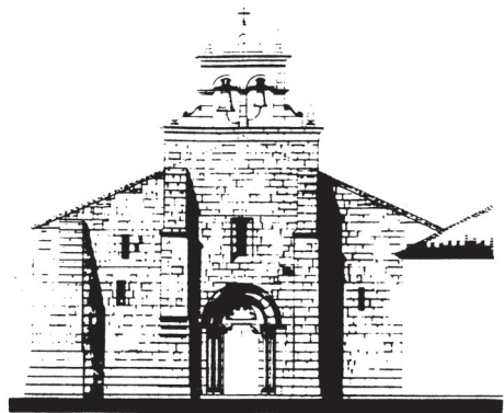
Fig. 1. Portada Occidental.

Aunque no son numerosos los testimonios documentales que permiten descifrar con claridad la historia de este edificio, en el período comprendido entre los siglos XII al XV, es la propia fábrica de la iglesia la que aporta mayor número de datos, así como la enorme tradición monacal que hubo en toda la extensión del territorio de As Mariñas , lo que permite completar el discurso histórico de este conjunto. Es preciso tener en cuenta la importancia