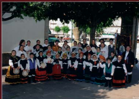
Escola Municipal de Folclore 2004

Día 24: Organización do Festival do "Día de Galicia" na praza García Hermanos de Betanzos,