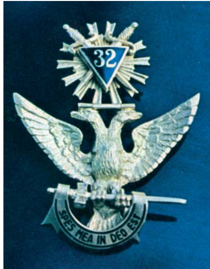
Joya del grado 32. Es el grado que alcanzó Bakunin en la masonería.

C.- Por llegar a sostener la lógica y deductiva hipótesis de que aquellos internacionalistas pudieron seguir, conscientemente, la ya vieja tradición revolucionaria liberal de apropiarse de ritos o usos y, sobre todo, iconos masónicos, con el fin de poder representar así, emblemáticamente, los nuevos valores ideológicos de: igualdad, federalismo, solidaridad,