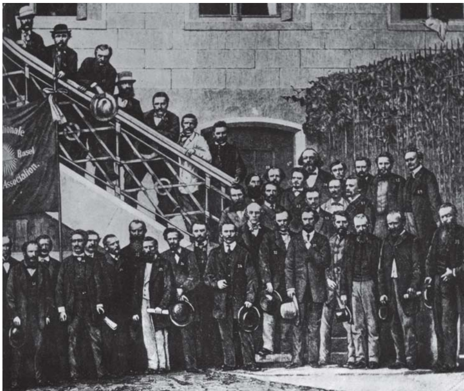
IV Congreso de la Internacional. Basilea, septiembre de 1869.

viese, de lo que, en puridad, pretendía la Asociación Internacional de Trabajadores o, como se denominó en Gran Bretaña, la International Workingmen's Association : buscar un utópico mundo universal o internacional de sublime, sabio y equitativo equilibrio por medio de la recta práctica moral del igualitarismo social?