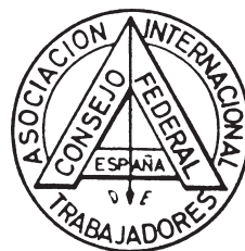
Sello distintivo del Consejo Federal de España de la A.I.T.

Los objetivos inmediatos contenidos en el programa de esta masonería «menfita» que, por otro lado, casi cuatro decenios más tarde, en plena Primera restauración borbónica, llegaría a España cobijando a una buena zona del republicanismo y del obrerismo español de final de siglo, eran, como nos dice Combes, dos: la lucha contra la ignorancia por medio de la escolarización, y «la ayuda al proletariado en su emancipación», especialmente, por