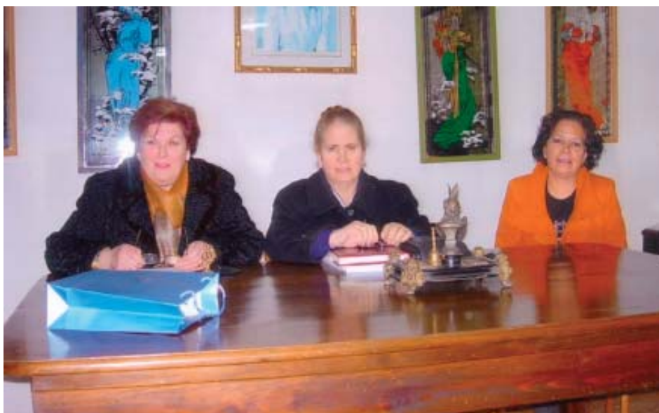
Conferencia impartida por la presidenta provincial, doña Rosa Otero, en el local de las Amas de Casa.