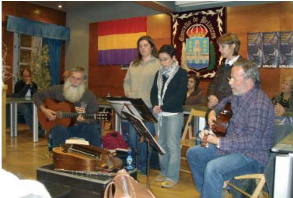
A Quenlla pon remate ao recital poético musical en homenaxe á guerrilla galega antifranquista.