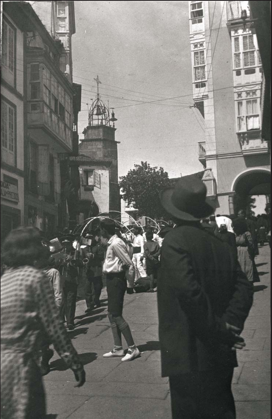
Betanzos nas festas de San Roque: 16 de agosto de 1930.