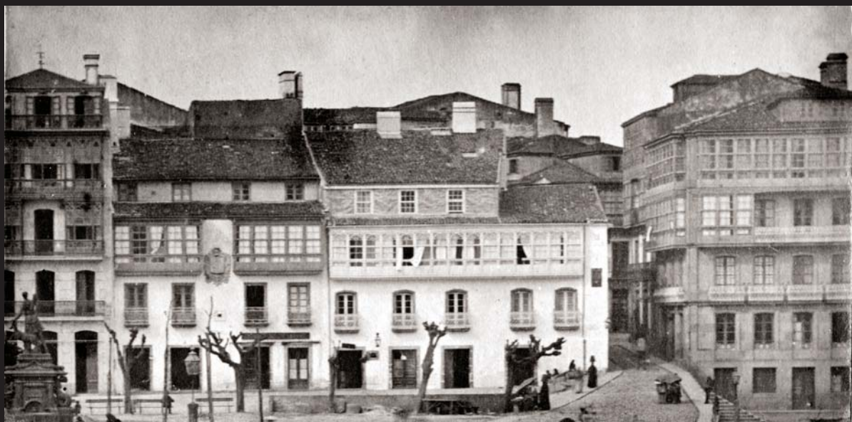
Arriba, Cantón Grande e Porta da Vila arredor de 1900. Foto: Francisco Javier Martínez Santiso. Abaixo, a desaparecida Ponte Nova quizaís na década de 1940. Autor descoñecido.