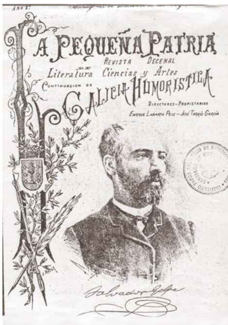
Portada de La Pequeña Patria, dedicada a Golpe (Santiago, 20-XII-1890).

Buen poeta, de la escuela romántica, cantó á Galicia, á sus héroes y sus hechos memorables en cultos y sentidos versos. En lengua gallega escribió pocas poesías, y de éstas, las más conocidas y apreciadas son las compuestas para poner en música, cumpliendo el propósito que formaron él y su entusiasta amigo—ya muerto también—D. Francisco de la Iglesia, de llevar el idioma gallego á los salones ciudadanos, haciéndolo cantar; por interés de vulgarizarlo así entre las gentes ilustradas, que tal inconsiderado desvío mostraban