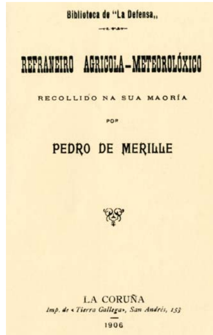
Portada do Refraneiro Agrícola-Meteorolóxico, publicado co pseudónimo «Pedro de Merille».

O refraneiro de Golpe é unha pequena colleita de apenas douscentos cincoenta e seis refráns, clasificados por orde alfabética, máis uns corenta que engade como apéndice ao remate e que lle foran enviados por colaboradores anónimos, por iso di na portada «Recollido na sua maoría por Pedro de Merille». Esteseudónimo utilizado polo escritor nesta única ocasión, que nós saibamos, fai alusión ao lugar dese nome na parroquia de Lesa, que Golpe podía ollar dende o seu pazo de Paio, río Mendo por medio. Os refráns van seguidos duns «Prenósticos do tempo», que son ditos populares relacionados coa meteoroloxía. Se ben non é unha recopilación moi extensa, ten o mérito de ser unha das primeiras publicadas como tal e non de apéndice a outras obras.