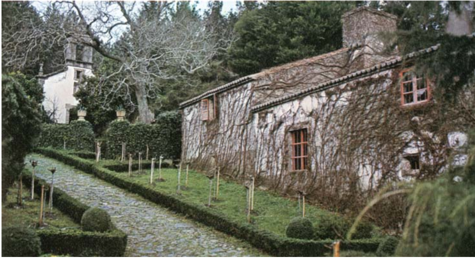
Vista do pazo de Paio (tomada de Martínez Barbeito, 1978).

Non debía ser moi amigo Golpe dos propios retratos e menos de distribuílos, a vulgar por esta quintilla que apareceu en El Eco de Galicia da Habana (nº 156, 2ª época, 21-VI-1885):