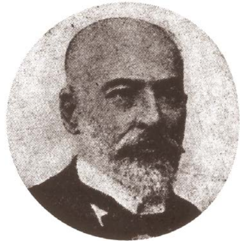
Portada do Boletín da Academia dedicado a Golpe á súa morte (arriba) e retrato dos últimos anos do poeta.