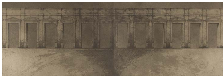
Grabado calcográfico de José Hernández. Donación del autor al CIEC.

Este agradecimiento queremos hacerlo extensible también a los profesores, alumnos, artistas, aficionados y visitantes de este 2009, con el deseo de volver a encontrarnos en 2010.