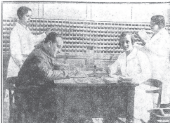
DIRECTIVOS EN LA TAREA SEMANAL DE RECOGER LAS IMPOSICIONES 22

Existía, legalmente establecida, desde 5.1.1930, la Mutualidad Escolar Labaca con su correspondiente órgano de información El Previsor , boletín de la citada mutualidad 19 . Esta era la primera Junta Directiva, de tal mutualidad, elegida por votación: