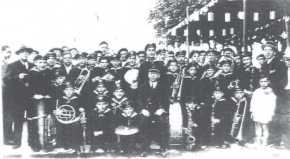
Banda musical de las Escuelas Labaca.