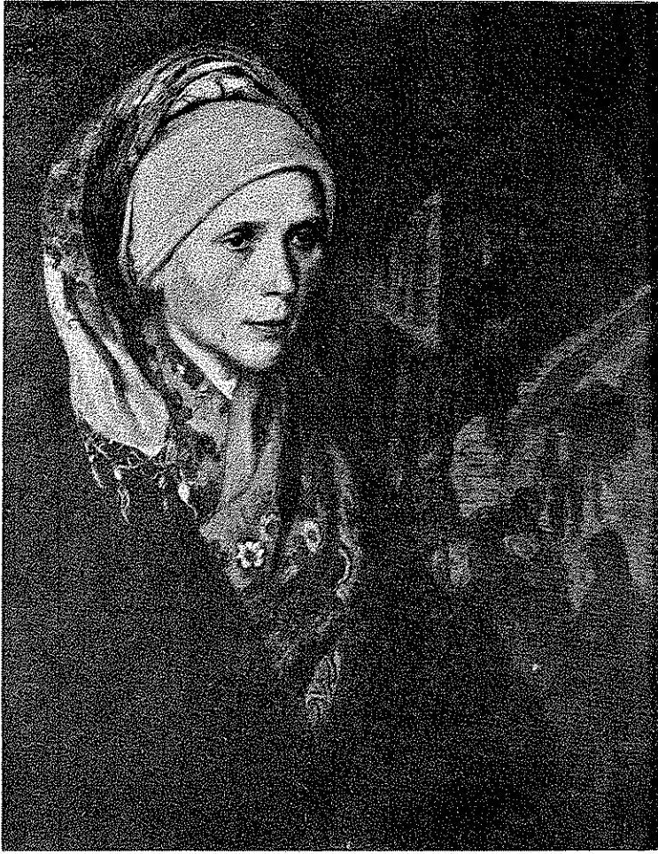
FERNANDO ÁLVAREZ DE SOTOMAYOR. — "Balançeira".