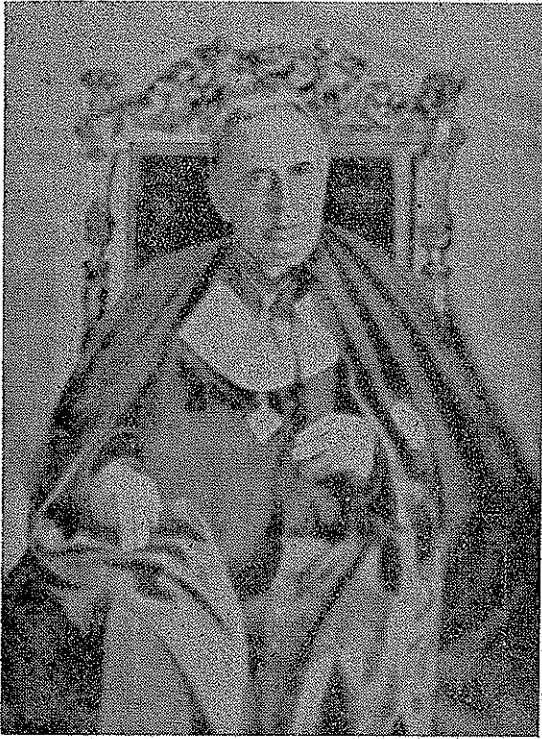
R. P. FIDEL FITA, S. J.,

Director que fué de la Real Academia de la Historia.