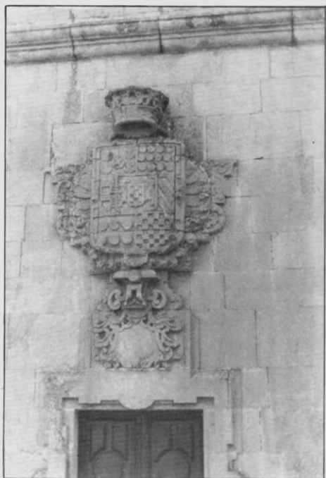
Diversos aspectos del Pazo de Anzobre. En la parte inferior derecha blasón de la fachada de la capilla...