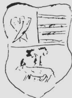
Heráldica de Los Bugueiro y variante del blasón de Los Bugueiro (primer cuartel). Apuntes del autor.