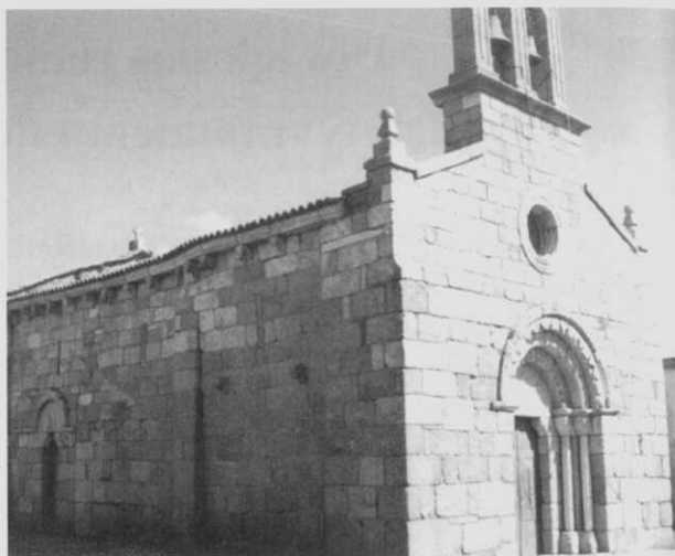
Iglesia de Dexo.

- Año 1199: Según la inscripción del pórtico es el año en que se construye la portada, bastante deteriorada por la erosión de las piedras.