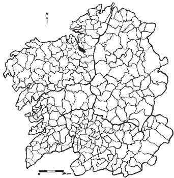
Fig. 2.- Situación do Concello de Coirós.