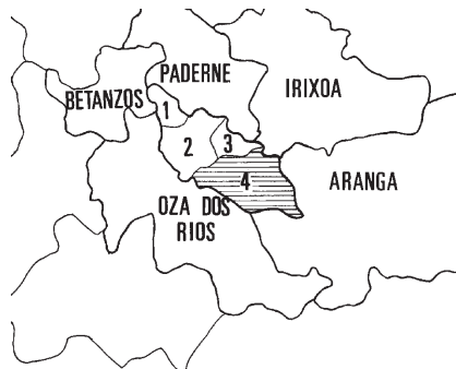
Fig.3.- División parroquial do Concello de Coirós.: 1, Colantres; 2, Coirós; 3, Santiago de Ois, e 4, Sta. Mª de Ois.

petroglifo de Chamorro-Ferrol 1 , Sta. Catarina de Montefaro-Ares? 2 , Pena Branca-Vilarmaior 3 , Edreiros-Monfero 4 , Rego de Pazos-Vilarmaior 5 , A Covacha-Paderne 6 e este que agora presentamos en Fonte do Oso-Coirós 7 .