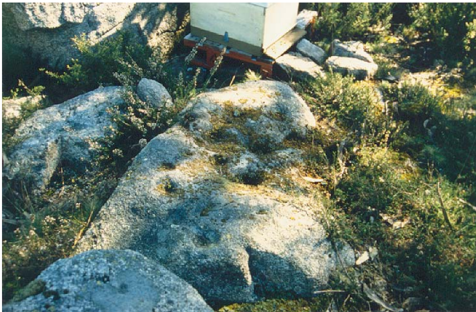
Fig. 7.- Vista parcial das cazoletas de Revoltas Longas (Santa M a de Ois, Coirós).