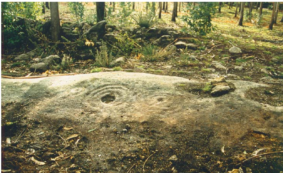
Fig. 6.- Petroglifo de Fonte do Oso-I (Fontela, Santa M a de Ois, Coirós, A Coruña) en perigo de se destruír por estar situado no medio dun vello camiño.