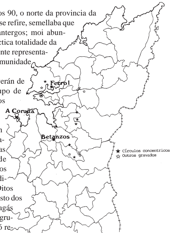
Fig. 1.- Plano de situación de gravados no Norte da Provincia da Coruña.

Non é o obxectivo deste artigo o establecer un catálogo dos gravados rupestres de combinacións circulares aparecidos na zona anteriormente mencionada, pero convén destacar que na última década, déronse a coñecer (establecendo unha orde xeográfico de N a S) o