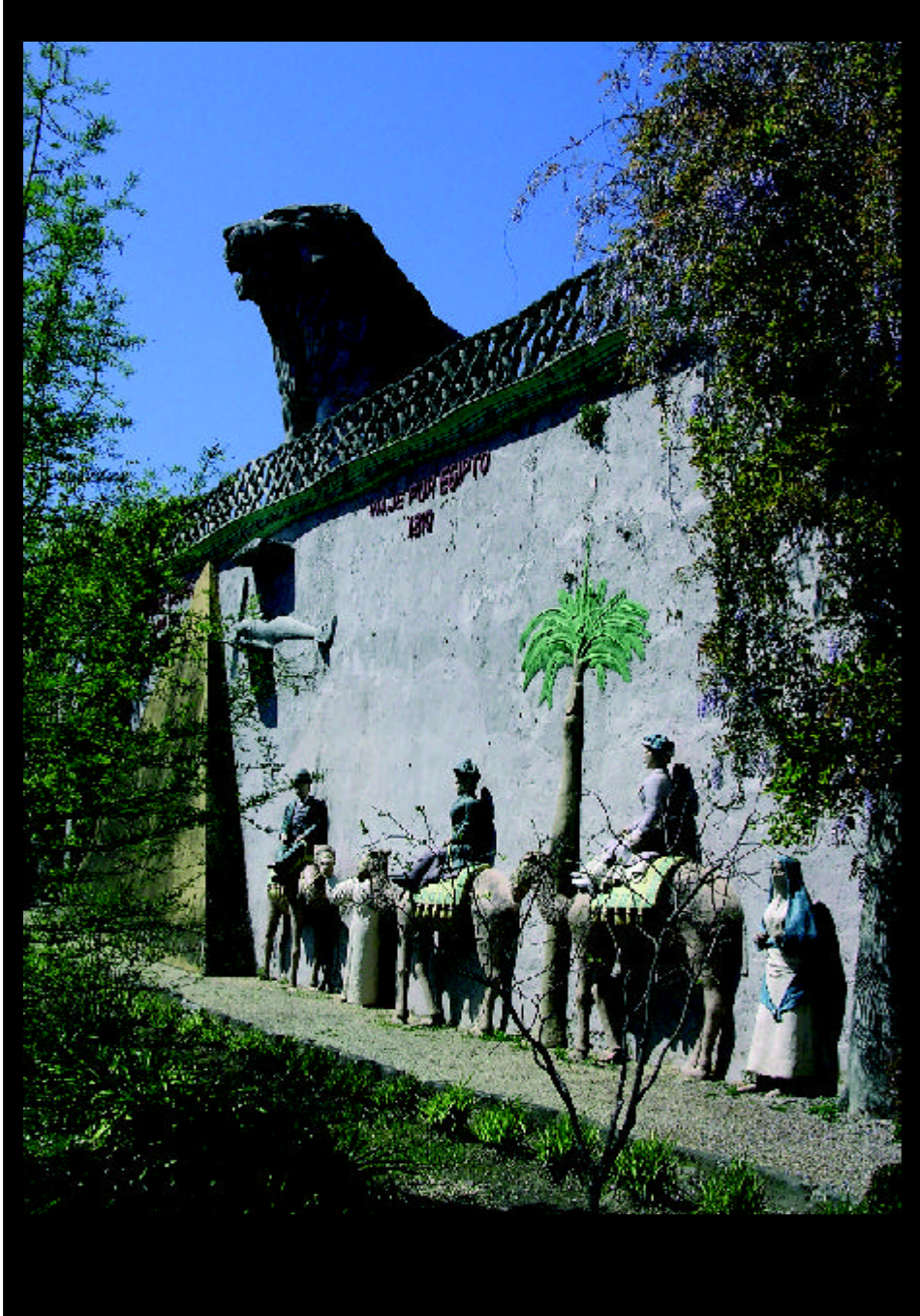
«El Pasatiempo».