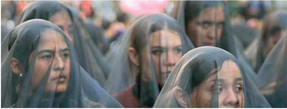
Para as Muchachas de Ciudad Juárez. [México]

Na faciana desa terra quente instalouse o asubiar dun vento tolo que cuspe feroces historias futuras. Un vento incongruente preñado dunha sombra difusa que medra cara adentro, que fai a vida ausente.