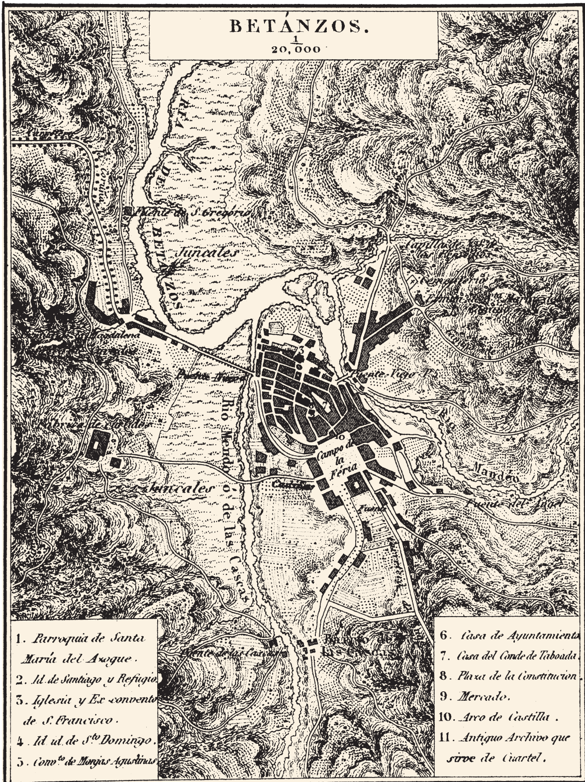
Plano de Betanzos en el mapa de la provincia de la Coruña, realizado por el coronel de ingenieros, Francisco Coello en 1865 para el Diccionario Geográfico-Estadístico-Histórico de Pascual Madoz.