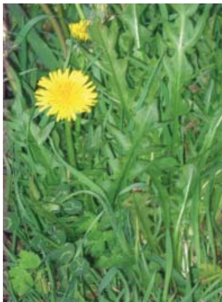
Dente de león (Taraxacum officinale)

En canto aos animais, tamén producía aumento do volumen abdominal, ademáis de tumores nos pés, coxas ou escroto e podía afectar a calqueira tipo de gando. Ás veces era producido por unha alimentación non axeitada. Para curalo recorríase aos ritos dos terróns mencionados anteriormente, pero aquí usábanse catro terróns e a administración de purgantes e de coceduras de certas plantas como a raíz de pirixel ( Petroselinum hortense ) ou o apio ( Apium graveolens ). Xa en tempos máis modernos, alá polo 1900, os albeites collían na farmacia 50 cc. de esencia de trementina e 25 cl. de mezclilla e dábanlle fregas por todo o lombo.