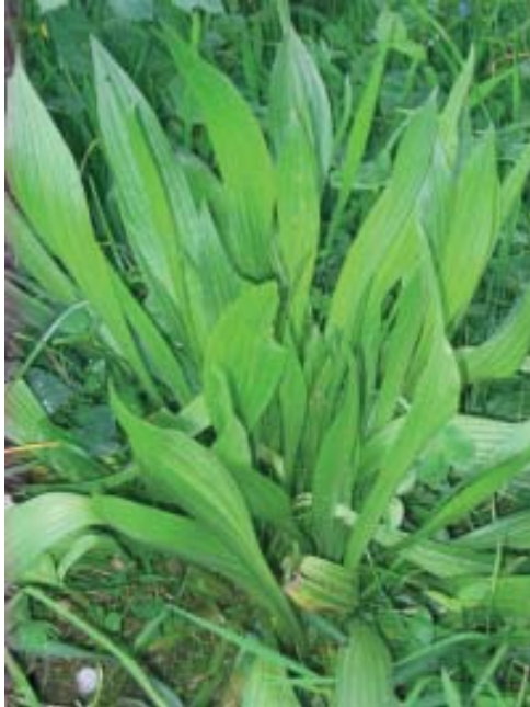
Chantán menor (Plantago lanceolata).

tizno da cheminea facendo as nove cruces de rigor e unha sen contar durante nove días e un sen contar. En vez de unto tiznado valía tamén un trapo tiznado. O ensalmo anterior tamén valía para esta enfermidade.