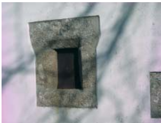
Xanela da capela de San Bieito.