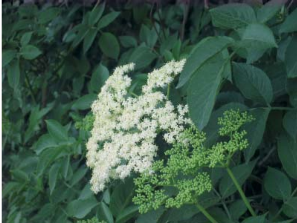
Biouteiro (Sambucus nigra).