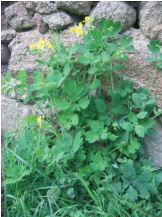
Celidonia (Chelidonium majus).