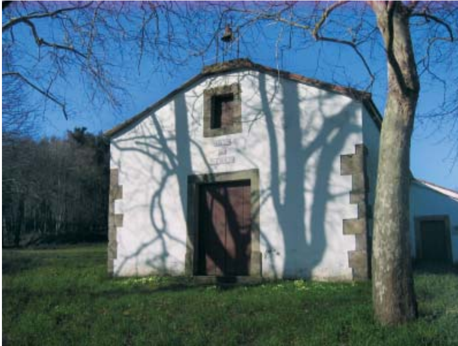
Capela de San Bieito (Anceis, Cambre).