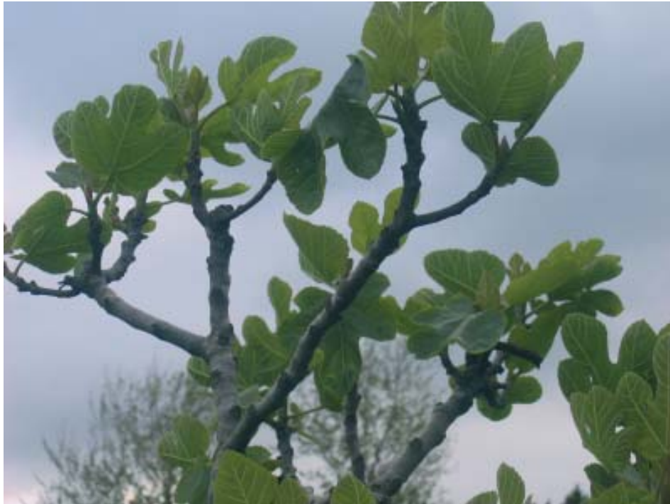
Figueira (Ficus carica).

medio dos prados, antes era de canteiría e tiña cano, hoxe é só unha mina de auga case tamén desaparecida. A xente afectada ía alí antes de raiar o sol, mollaba un trapo na fonte e pasabao nove veces e unha sen contar , recitando o ensalmo que veremos despois, pola parte afectada. Logo deixaba os trapos sobre o prado e botaba na fonte algunhas moedas, sempre en número impar, en agradecemento pola curación. Por certo, estas moedas eran recollidas polos picariños lavándoas na mesma fonte para evitar contaxiarse desta enfermidade.