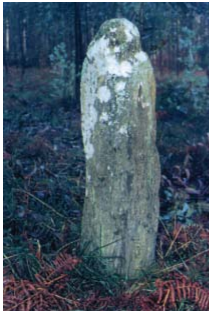
Marco da Fonte das Meigas ou da Fonte Salgueiras.

Nótese aquí outra vez un ensalmo de carácter infantil, xa que o que se ía curar era un neno.