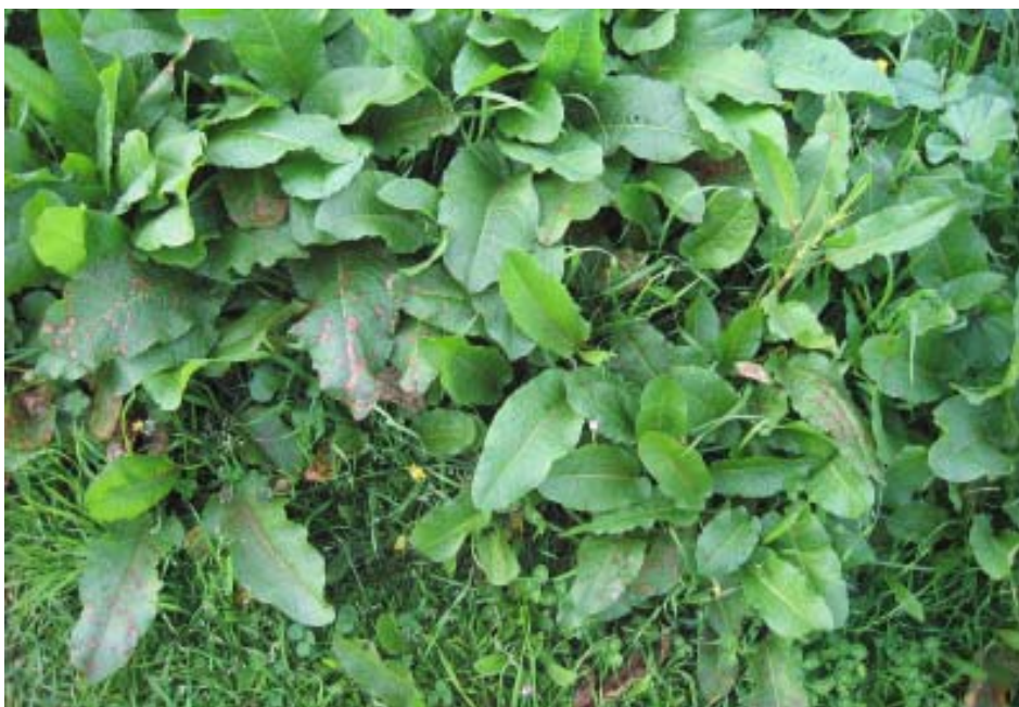
Labaza (Rumex pulcher).

A auga de neve era un remedio moi eficaz e moi usado en tempos dos nosos avós. Había que coller a neve, sobre todo a da primeira nevada (hai que recoñecer que nestas comarcas por nós estudadas nevaba moi poucas veces) e gardala nun tarro nun lugar seco e escuro para cando fose necesario. Algúns falannos de que valían tamén as saraibas. Moitos usábanas sen máis artiluxio, pero a verdadeira auga de neve era a que engadía nun tarro a esa primeira neve, xabrón virxe, que se raspaba sobre ela, e un pouco de aceite de oliva. Logo tamén había que extendela sobre a queimadura cunha pluma de galiña.