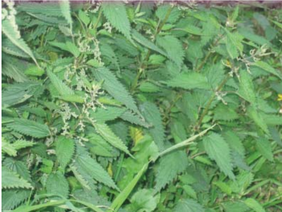
Ortigas ou estrugas (urtica sp).

colocábase a cabeza do enfermo sobre ela, poñendo unha toalla ou saba cubrindo cabeza e pota para que os bafos non se perdesen e entrasen na maior cantidade posíbel polo nariz e a boca. Mantíñase así ao enfermo durante 20 ou 30 minutos dúas ou tres veces ao día. Logo secábase a suor do peito cun trapo mollado e deitábase ao enfermo arroupandoo ben. A mellor pota era un pucheiro de barro, pois retiña máis a calor.